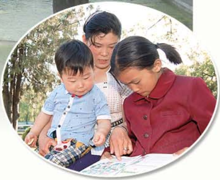
У пруда «Сучжон».

В народной песне «Янсандо», воспевающей красоту ряда достопримечательностей, раскинувшихся вдоль реки Тэдон, наряду со знаменито красивой сопкой Моран в Пхеньяне есть и название Мэнсан.