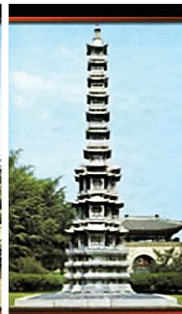
Похищавшаяся ими в Японию пагода буддийского храма Кёнчхон.

взорвали динамитом 7-ярусную каменную пагоду и похитили бывшую в ней ступу.