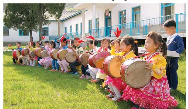
В Мэнсанских уездных детских яслях.

ную пищевую фабрику, где производят более 40 продуктов, включая вкусную, высокопитательную колбасу. Производители сказали, что под равномерным гулом разных видов отечественного оборудования