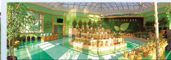
Место показа саженцев деревьев.