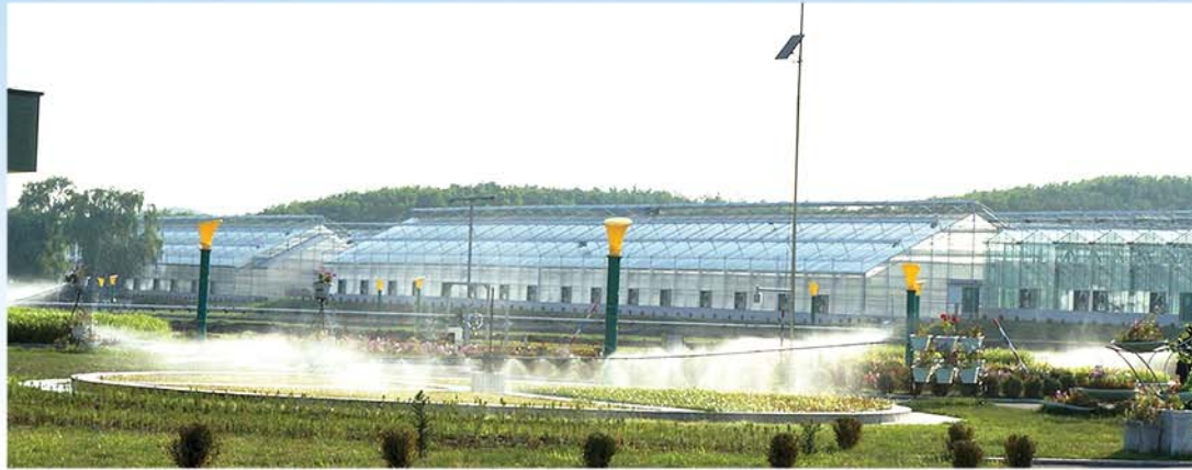
Круглое место вегетативного разведения.