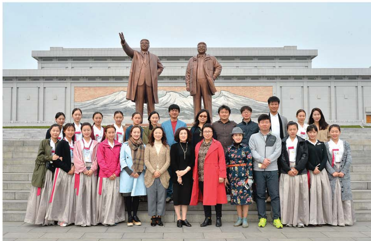
Перед статуями великих вождей на возвышенности Мансу.