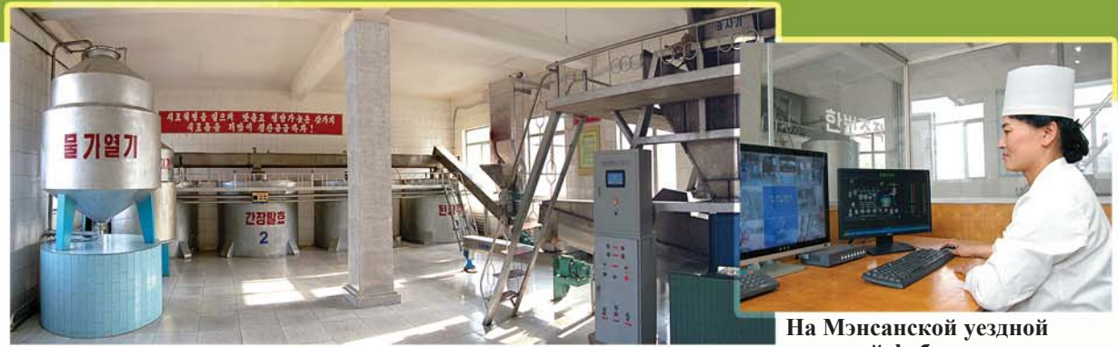
На Мэнсанской уездной пищевой фабрике.

В прошлом уезд Мэнсан считали местом, где людям плохо жить. Коренные изменения в нем настали в окружении заботы Полководца Ким Чен Ира. Он более 40 лет тому назад, посетив горное захолустье Мэнсан, куда затрудняются прилетать и птицы, подробно