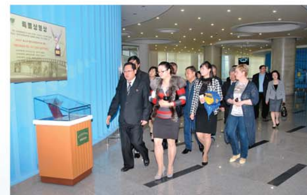
Зарубежные корейцы посетили Храм науки и техники.