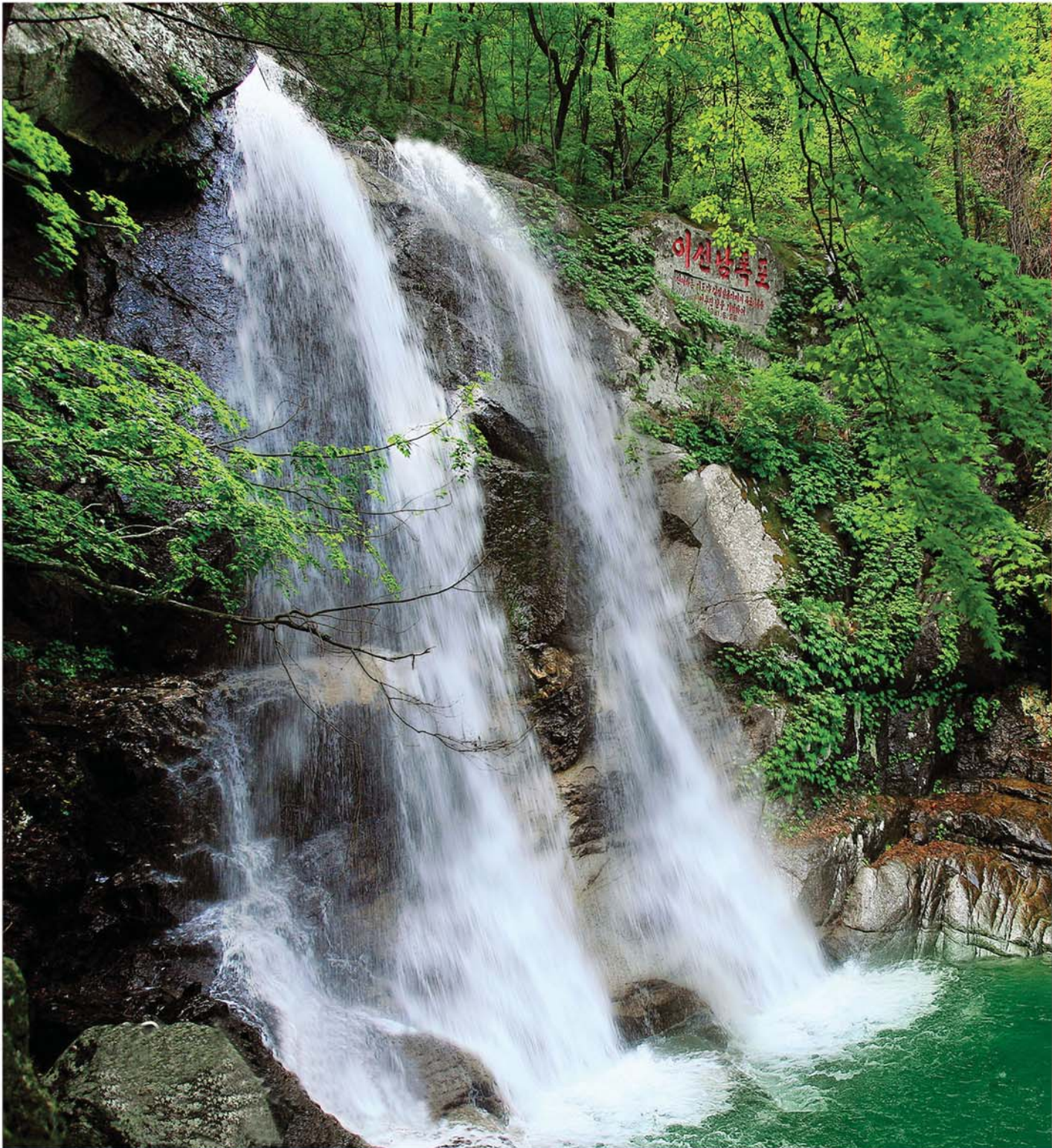
Водопад Исоннам в горах Мёхян.

Водопад Исоннам, низвергающийся, словно братья, рядом двумя потоками по каменистому склону, столкнувшись с одним из его выступов, вырывается вперед и падает в водоем, а затем протекает вниз. Приумножая чудесную красоту достопримечательных гор Мёхян, он находится на участке Чхонтхэ.