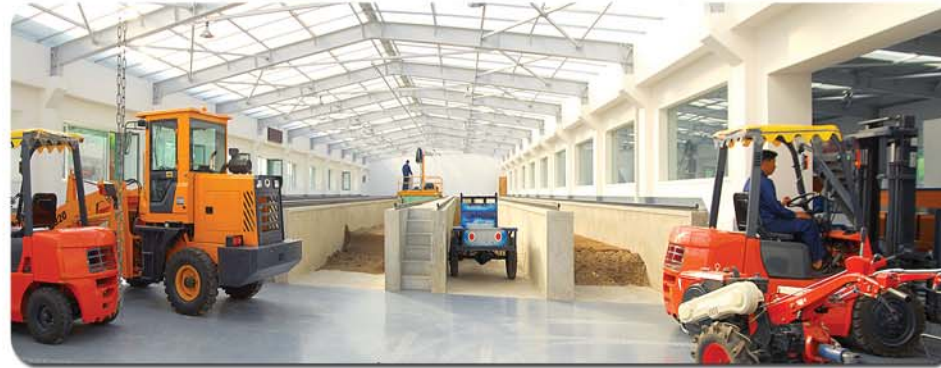
Производство горшков с легким субстратом.