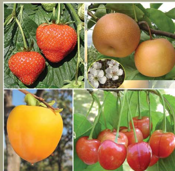
Разные снимки в «Своде иллюстраций с природным цветом фруктов по сортам».