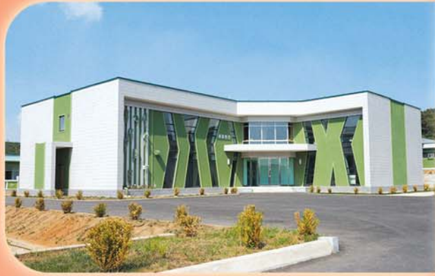
Место бытового сервиса.