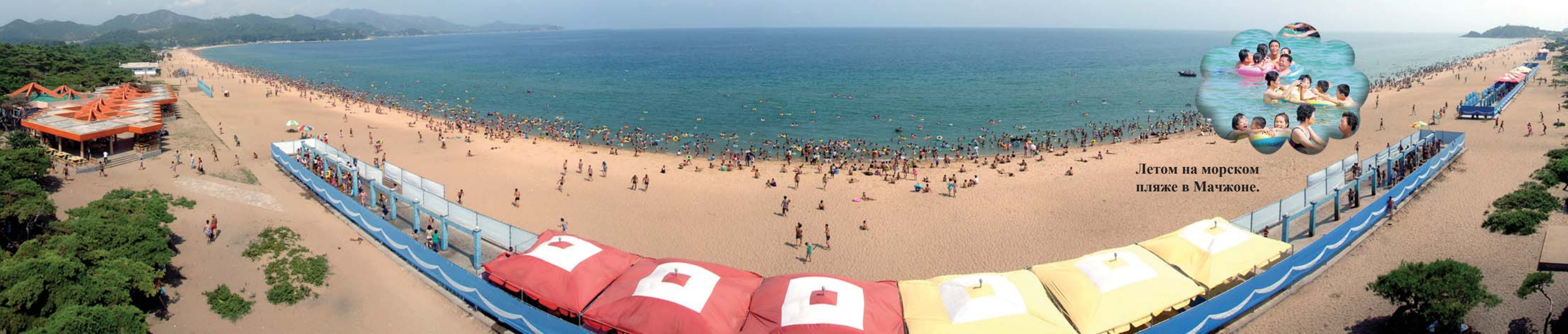
Летом на морском пляже в Мачжоне.