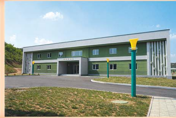
Место краткосрочных курсов.