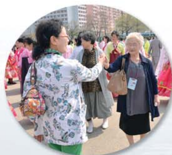
Радостные улыбки на танцах.

– Делегации Международного союза общественных объединений корейцев «Единство» и спонсоров художественной труппы корейцев в Китае –