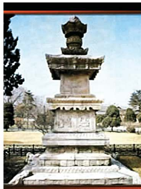
Японские оккупанты пытались в буддийском храме Попчхон похитить пагоду Хёнмё с останками чжигванкукса.

Самураи путем подкупа, шантажа, обмана и других махинаций похитили статуи Будды, имеющие большое значение среди реликвий в буддийских храмах, разрушили каменные художественные произведения и корейские колокольчики. Они похитили много каменных пагод, взорвали динамитом и разломали их для грабежа имевшихся в них золотых, серебряных, позолоченных медных изваяний Будды, башенок и бутылок с останками монахов. В середине 1930-х годов они в Кэсоне глубокой ночью под дождем и сверканьем молнии напали на буддийский храм Хёнхва корёского периода,