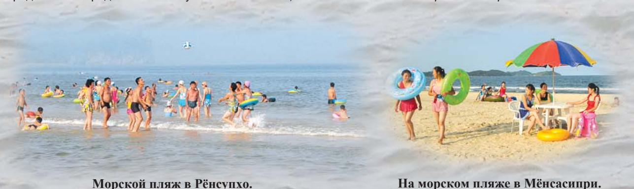
Морской пляж в Рёнсупхо.