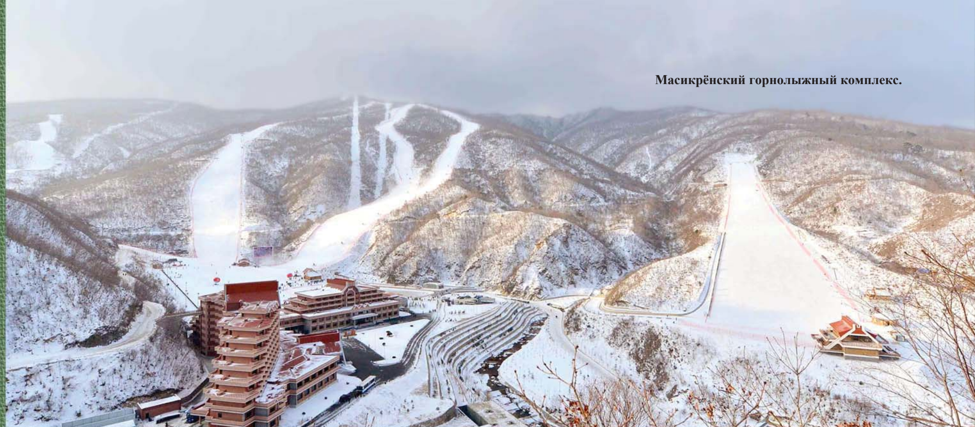
Масикрёнский горнолыжный комплекс.