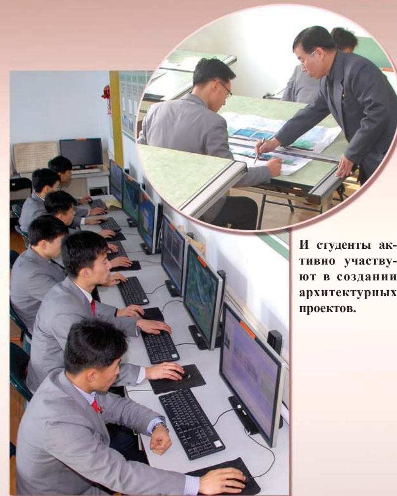
И студенты активно участвуют в создании архитектурных проектов.