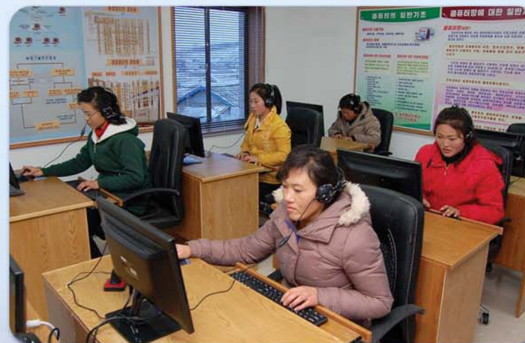
Сельхозкооператоры получают лекции при системе дистанционного обучения.