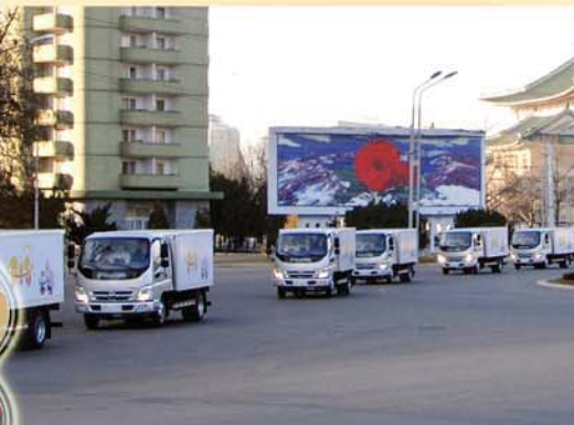
Дети постоянно снабжаются произведенными продуктами.