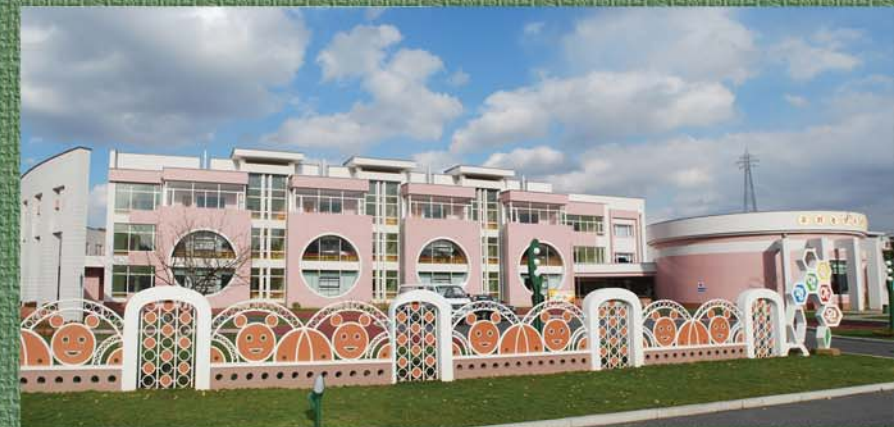
Пхеньянский дом ребенка.