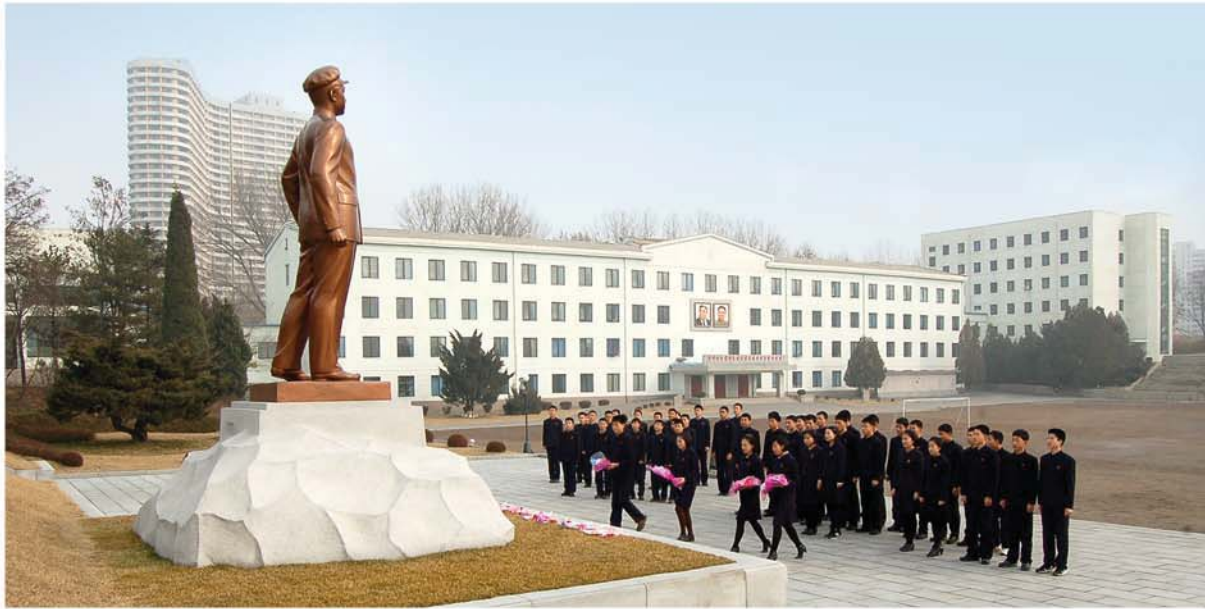
Перед установленной у школы бронзовой статуей Ким Ир Сена.