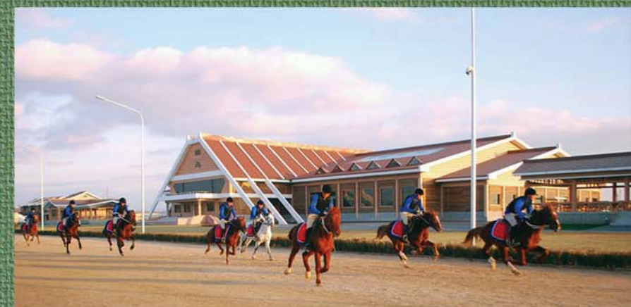
Миримский конноспортивный комплекс.