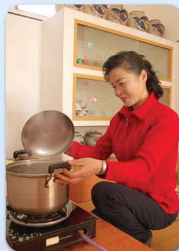
На кухне с метановой плиткой.