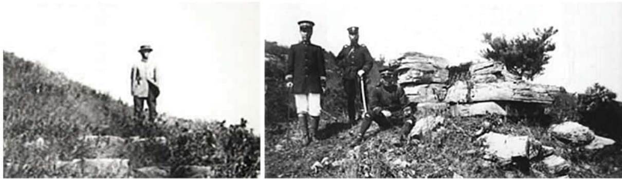
Наемный японский ученый, «расследующий» памятник старины, и помогающие ему японские полицейские.

Самураи, заявляя, что завершат работу по сбору в Японию ядра сокровищ Востока, постановили, что надлежит собрать все шедевры Кореи, Китая и других восточных стран, что это дело сводится, поистине, к прославлению страны ( Японии ). Самураи именно так восхваляли и подстрекали к ограблению культурных ценностей других стран. И так, по таким циничным и «законным» военным директивам агрессивного характера и во время китайско-японской войны были разрушены и похищены неисчислимые культурные ценности Кореи.