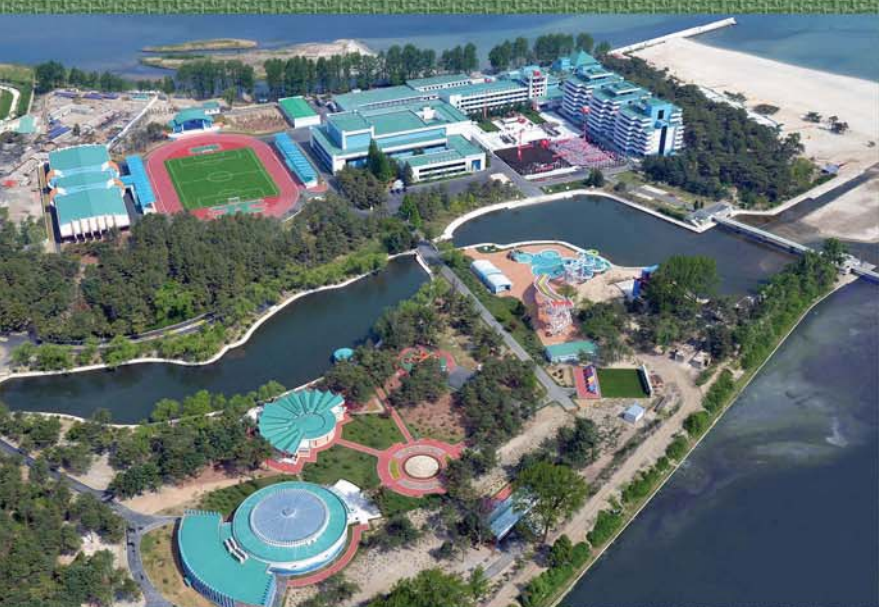
Сондовонский международный детсоюзовский лагерь.