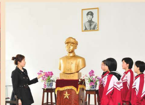
Корейцы в Китае посещают места историко-революционной славы, где Ким Ир Сен вел революционную деятельность.

над тем, как решить это дело, а при несчастье в семье соотечественника утешали его, ходя к нему порознь.