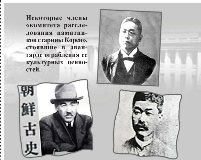
Некоторые члены «комитета расследования памятников старины Кореи», стоявшие в авангарде ограбления ее культурных ценностей.

Неофициальное и простое обращение к чиновникам велось в основном вместе с фамилией и должностью. В период Корё командующий всеми войсками 6 провинций Чвэ Ён назывался Чвэ