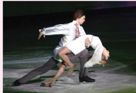
제23차 광명성절경축 백두산상국제휘거축전

아름답게 피어난 불멸의 꽃 김정일 화와 갖가지 진귀한 화초들로 하여 황홀경을 이룬 제18차 김정일 화축전장이 주는 여운 또한 컸다. 축전장을 돌아보며 참관자들은 주체조선의 존엄과 국력을 최상의 경지에 올려세우신 아버지장군님의 불멸의 업적을 가슴깊이 되새기었다.