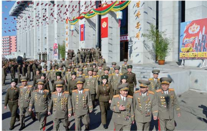
제111호 백두산선거구 선거자들

경애하는 원수님께서 선거에 앞서 대의원후보자추천사업이 진행될 때 제111호 백두산선거구 선거자대회를 비롯한 온 나라의 선거구들의 선거자대회와 회의들에서 최고인민회의 제13기