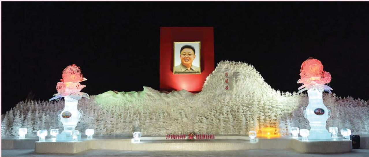
광명성절경축 얼음조각축전장의 일부

모의 정이 절절하게 흐르는 가운데 조선인민군 최고사령관 김정은 원수님께서서는 조선인민군 지휘성원들과 함께 금수산태양궁전을 찾으시고 아버지장군님께 가장 경건한 마음으로 삼가 인사를 드리시었다.