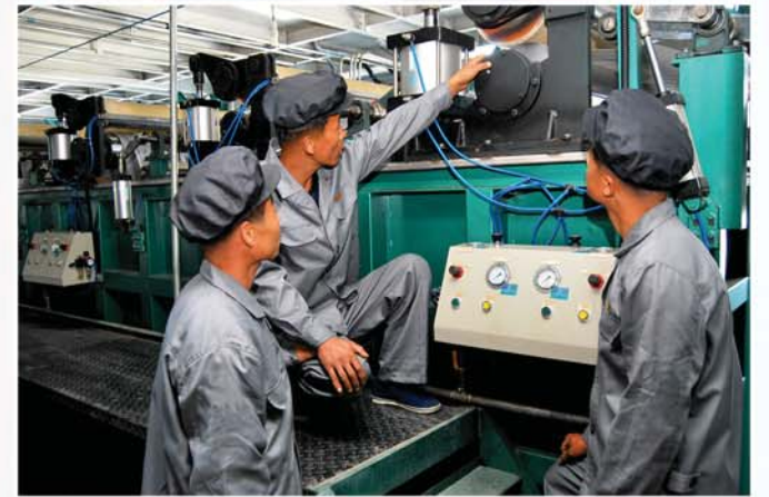
설비의 정상 가동을 위해

나라의 경공업을 발전시키고 인민생활을 향상시키는데서 자신들이 맡은 임무의 중요성을 자각한 이곳 종업원들은 최근 년간에 만도 용매회수설비, 습식수지도포