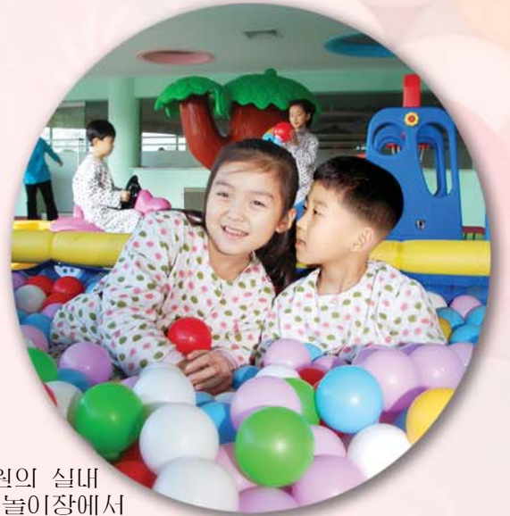
병원의 실내 놀이장에서

나를 데리고 검사하러 다니던 간호원언니는 경애하는 김정은원수님의 크나큰 은정속에 솟아난 병원은 6층으로 되어있다고 했다. 그리고 많은 입원실과 치료실, 3개의 놀이장과 치료체육실, 상점이 있고 밖에는 야외물놀이장과 분수터, 직승기착륙장까지 있다고 말해주었다. 나는 놀라왔다.