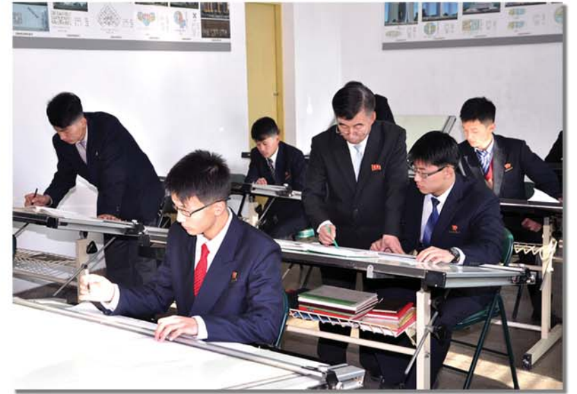
건축설계에 열중하고있는 학생들

실시간강의, 록화강의, 실시간적인 질의응답 등 원격교육망을 통한 교육사업에 힘을 넣고 있는 한편 5차원설계교육, 건축