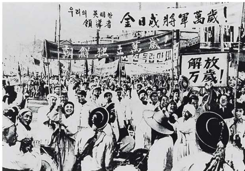
해방의 환희에 넘쳐있는 인민들

투사들을 핵심으로 하고 국내외에서 활동하던 공산주의자들을 망라하여 북조선에 강력한 당중앙지도기관인 북조선공산당 중앙조직위원회를 결성하고 당의 창건을 선포하시였다.