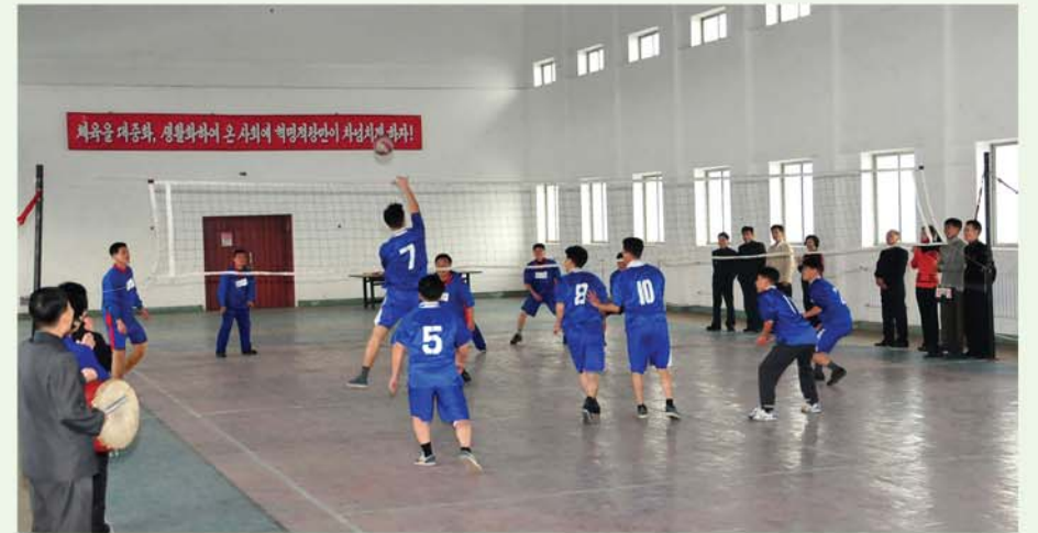
승부를 겨루는 배구경기

어떤 사람들은 자기가 마치 감독이라도 된듯 선수들의 이름까지 불리하며 열심히 경기를 지도하였다. 멋진 타격이 성공할 때마다 몸짓, 손짓까지 해가며 경기를 응원하고있는 사람들의 모습도 보이였다.