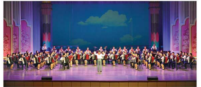
마음껏 재능을 꽃피우는 학생소년들

그 어떤 모진 시련속에서도 인민중시, 인민제일의 사상이 굳건히 이어지고 인민이 더 잘살 사회주의강성국가건설의 도약대가 튼튼히 다져졌다.