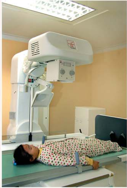
렌트겐검사를 받는 연미