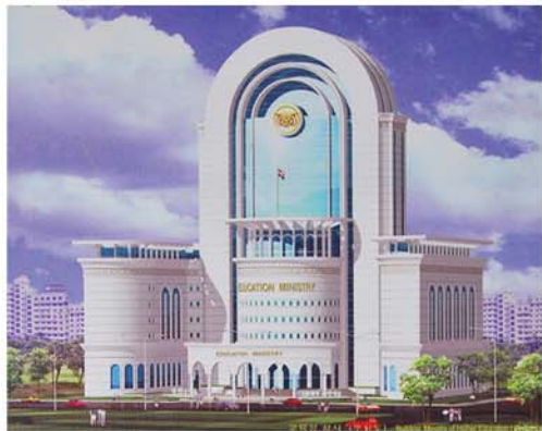
학생들이 창작한 건축설계형성안의 일부