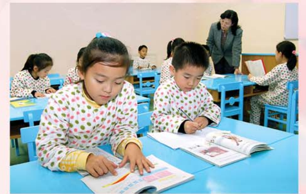
병원에서도 공부는 계속된다.