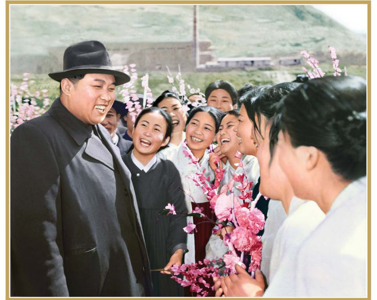
로동자들속에 계시는 위대한 수령 김일성대원수님 (주체50(1961). 4)