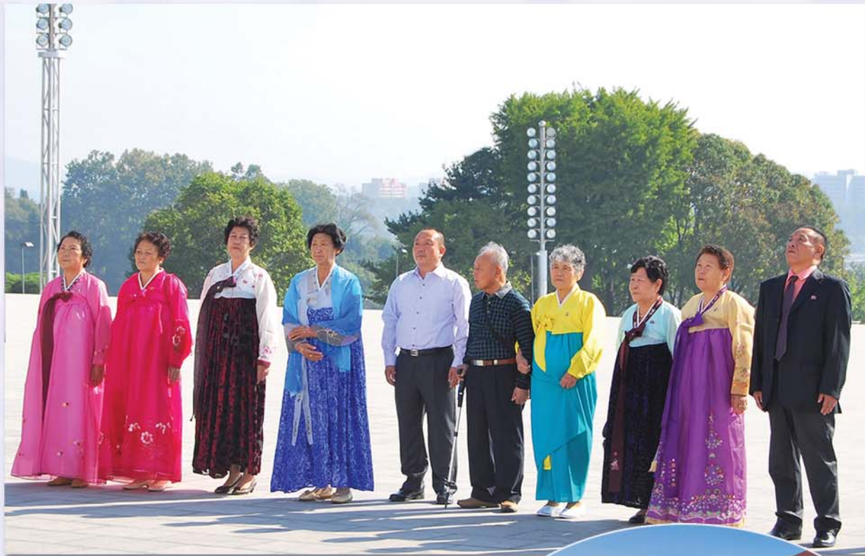
만수대언덕에 모셔진 위대한 대원수님들의 동상을 찾아 인사드리는 동포들