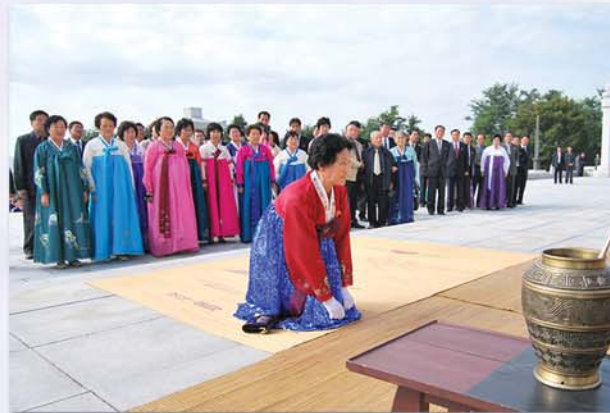
단군릉에서 진행된 개천절 기념행사에도 참가하였다.