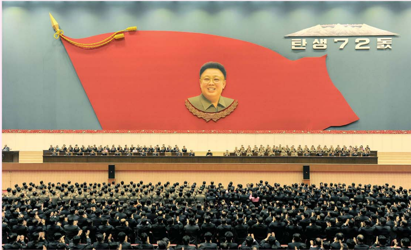
경애하는 김정은원수님을 모시고 위대한 김정일대원수님 탄생 72돐경축 중앙보고대회가 성대히 진행되었다.