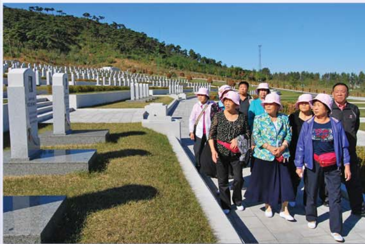
조국해방전쟁참전렬사묘를 돌아보는 동포들