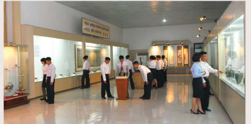
전시된 유물들의 일부