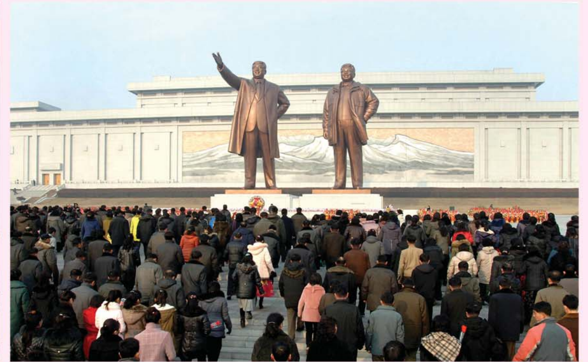
위대한 김일성대원수님과 김정일대원수님의 동상에 꽃바구니를 진정하였다.