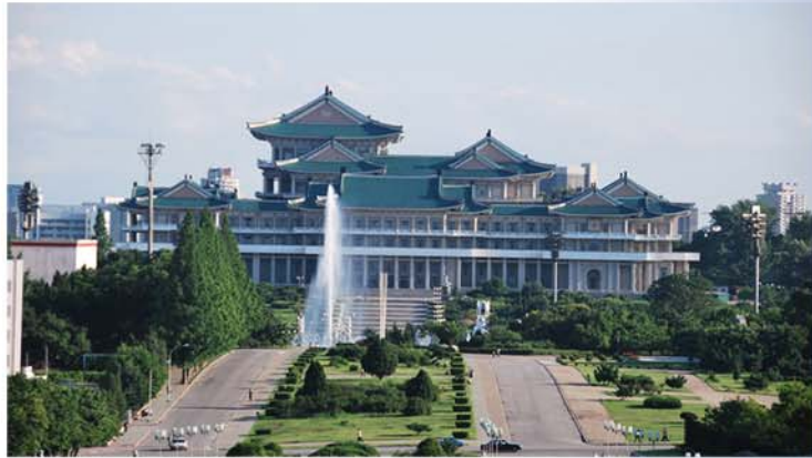
대학에서 설계한 건축물의 일부