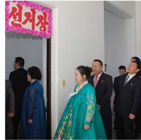
해외동포들도 선거에 참가하였다.