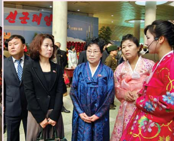
제18차 김정일화속진장을 찾은 재중동포들