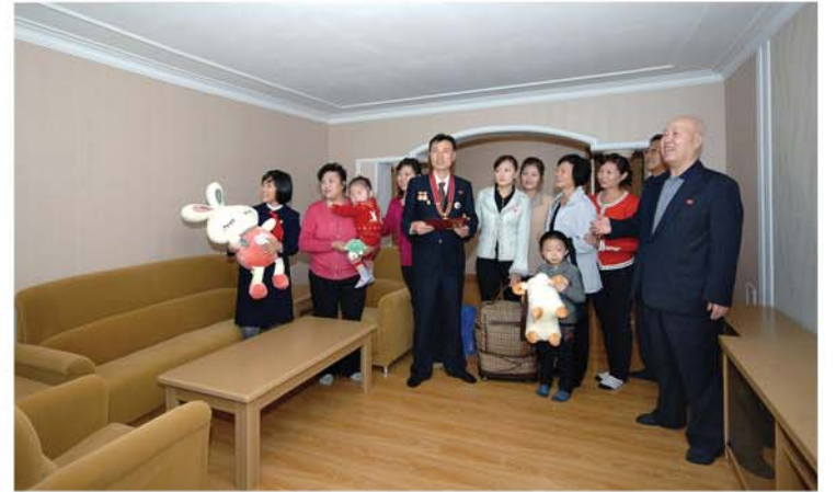
새집들이한 교원, 연구사들

비록 그이께서 서거하신 때로부터 20년, 강산이 변한다는 세월이 두번이나 흘렀지만 그이의 사상과 위업을 빛나게 계승하신 위대한 김정일대원수님의 령도밑에 조국에서는