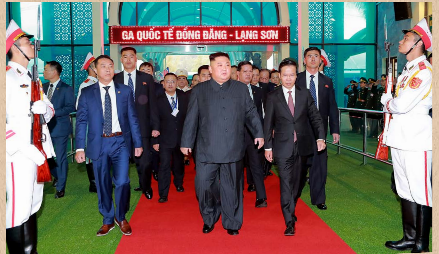
월남의 국경역인 동당역에 도착하신 경애하는 최고령도자 김정은동지 주체 108(2019)년 2월 Supreme Leader Kim Jong Un arriving at Dong Dang Railway Station, a border station of Vietnam, in February 2019