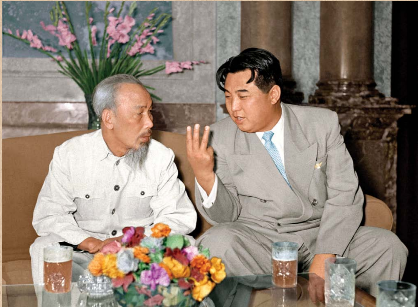
월남민주공화국 주석 호지명동지와 담화하시는 위대한 수령 김일성동지 주체47(1958)년 11월 Kim Il Sung and Ho Chi Minh having a talk in November 1958