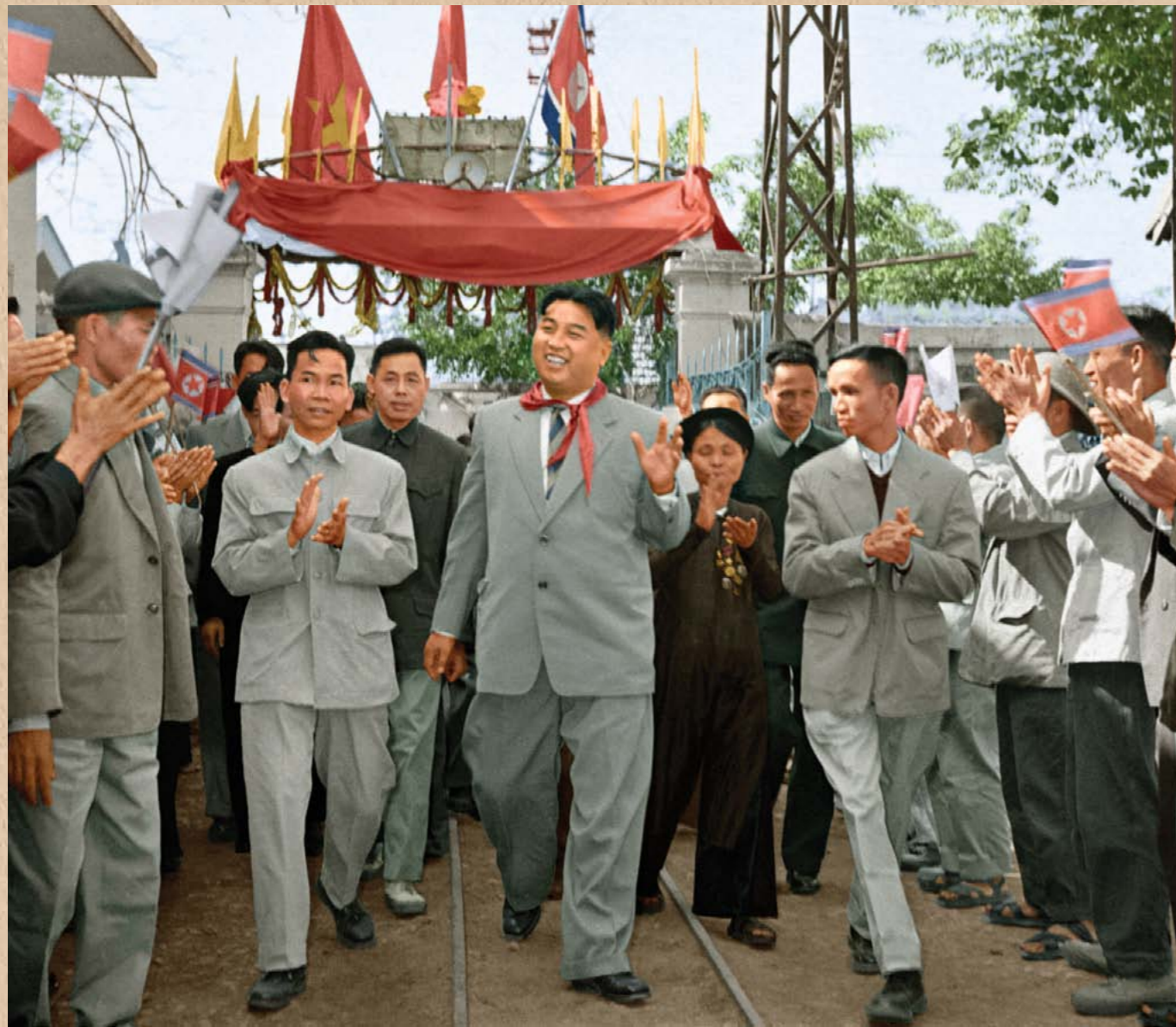
남딩방직공장을 찾으신 위대한 수령 김일성동지 주체47(1958)년 11월 Kim Il Sung looking round a textile mill in Nam Dinh in November 1958