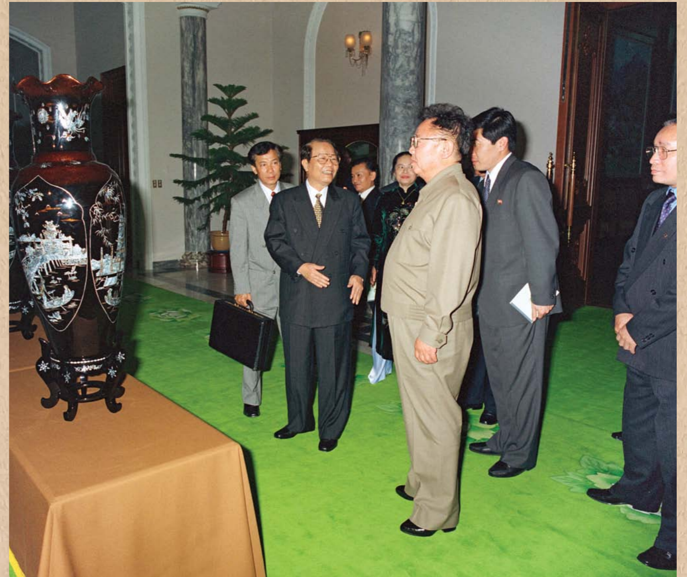
월남사회주의공화국 주석 쩌 득 르엉동지와 상봉하시는 위대한 령도자 김정일동지 주체91(2002)년 5월 Chairman Kim Jong Il meeting President Tran Duc Luong of the Socialist Republic of Vietnam in May 2002