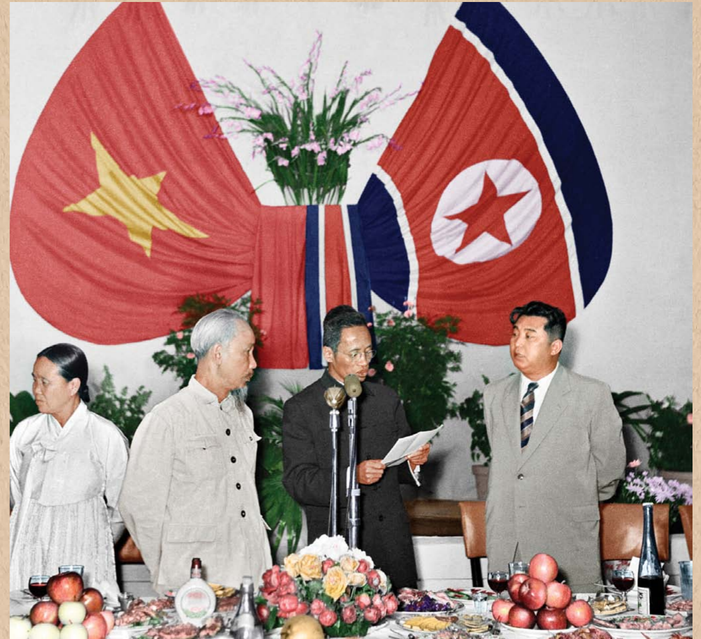
월남민주공화국 정부수상 범문동동지가 차린 연회에 참석하신 위대한 수령 김일성동지 주체47(1958)년 11월 Kim Il Sung attending a banquet arranged by Vietnamese Prime Minister Pham Van Dong in November 1958