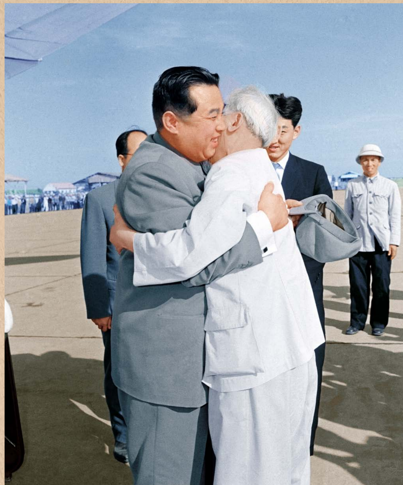
월남민주공화국을 방문하시어 호志明주석과 뜨겁게 포옹하시는 위대한 수령 김일성동지 주체53(1964)년 11월