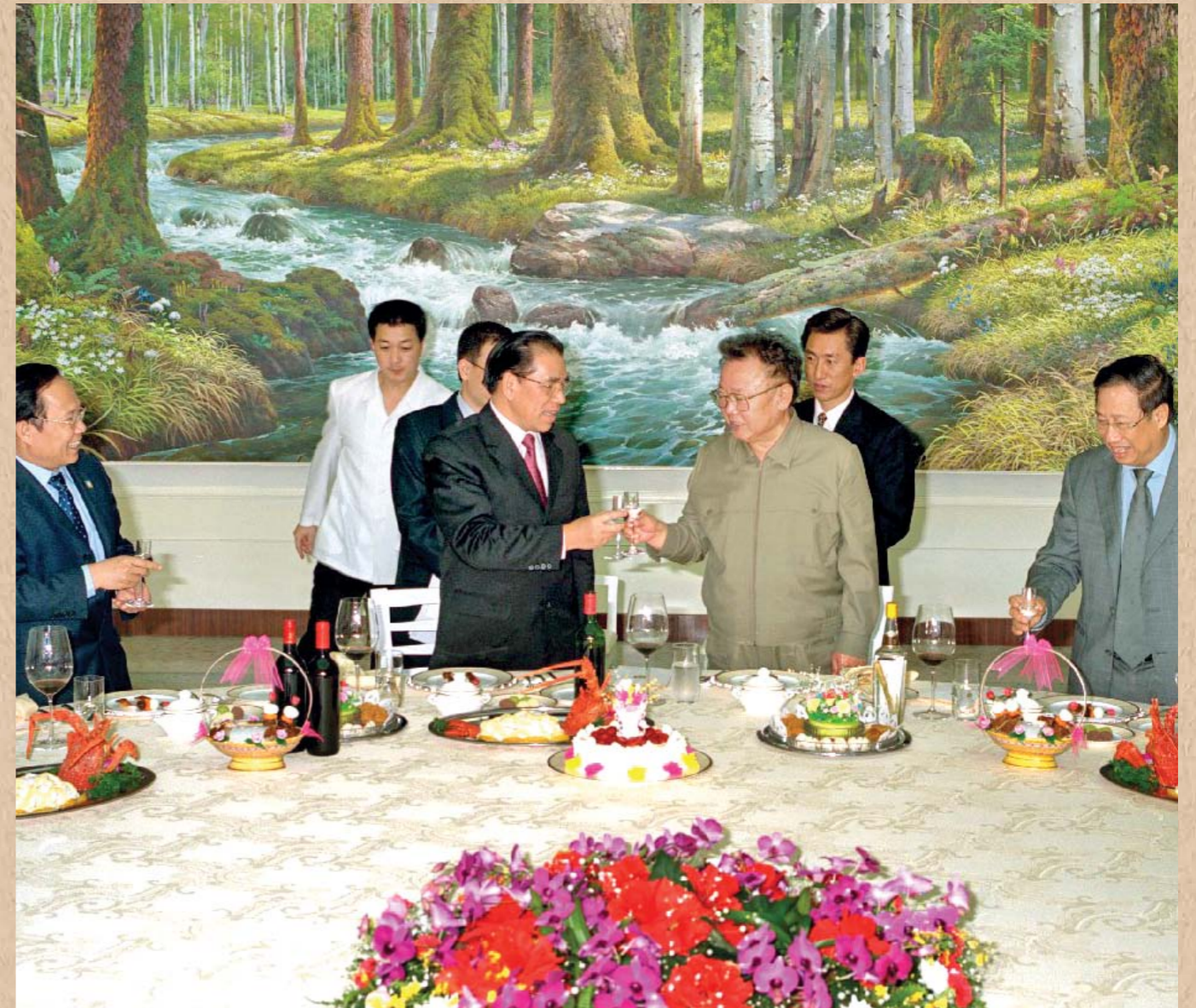
월남공산당 중앙위원회 총비서 농 득 마잉동지의 숙소를 방문하시고 오찬을 함께 하시는 위대한 령도자 김정일동지 주체96(2007)년 10월