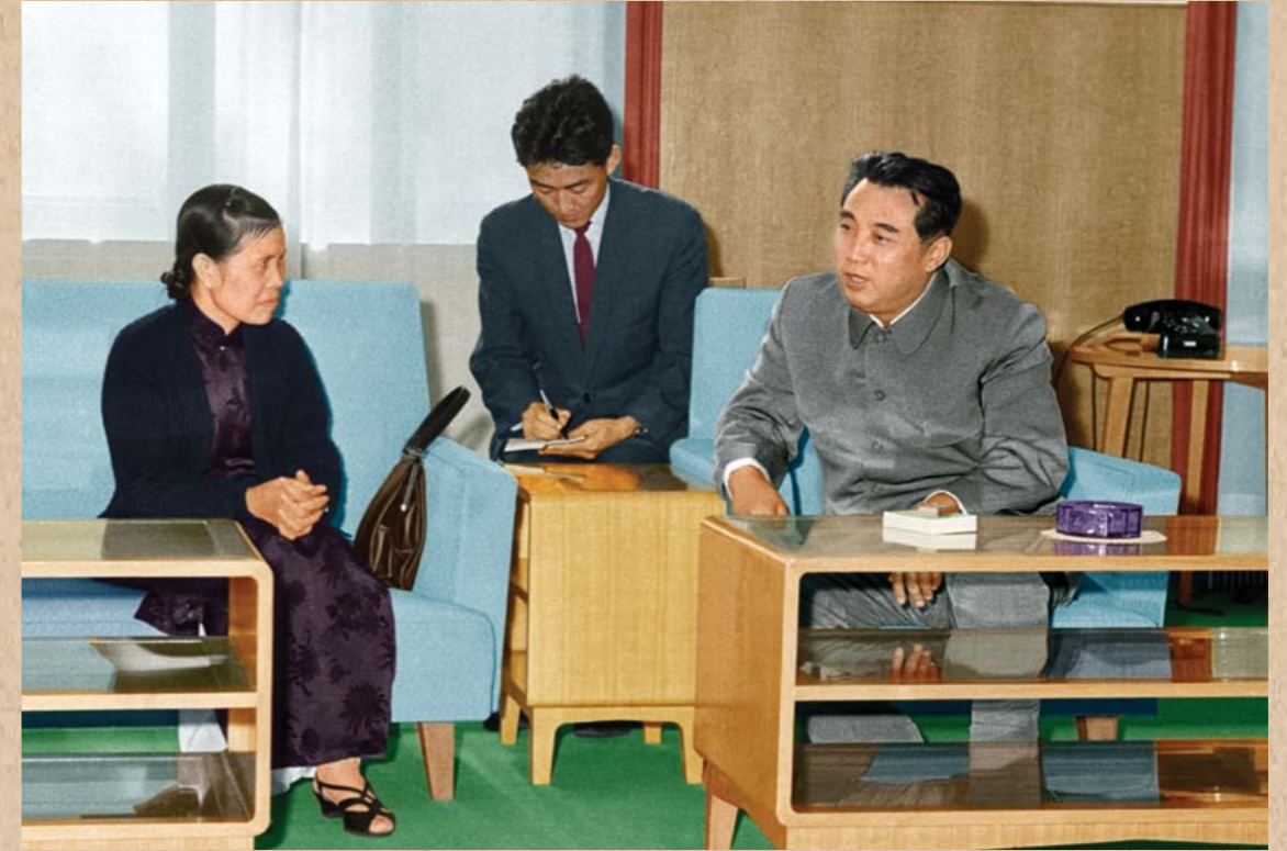
월남조선친선협회대표단 성원을 접견하시는 위대한 수령 김일성동지 주체55(1966)년 9월 Kim Il Sung meeting a member of the Vietnam-DPRK Friendship Association delegation in September 1966