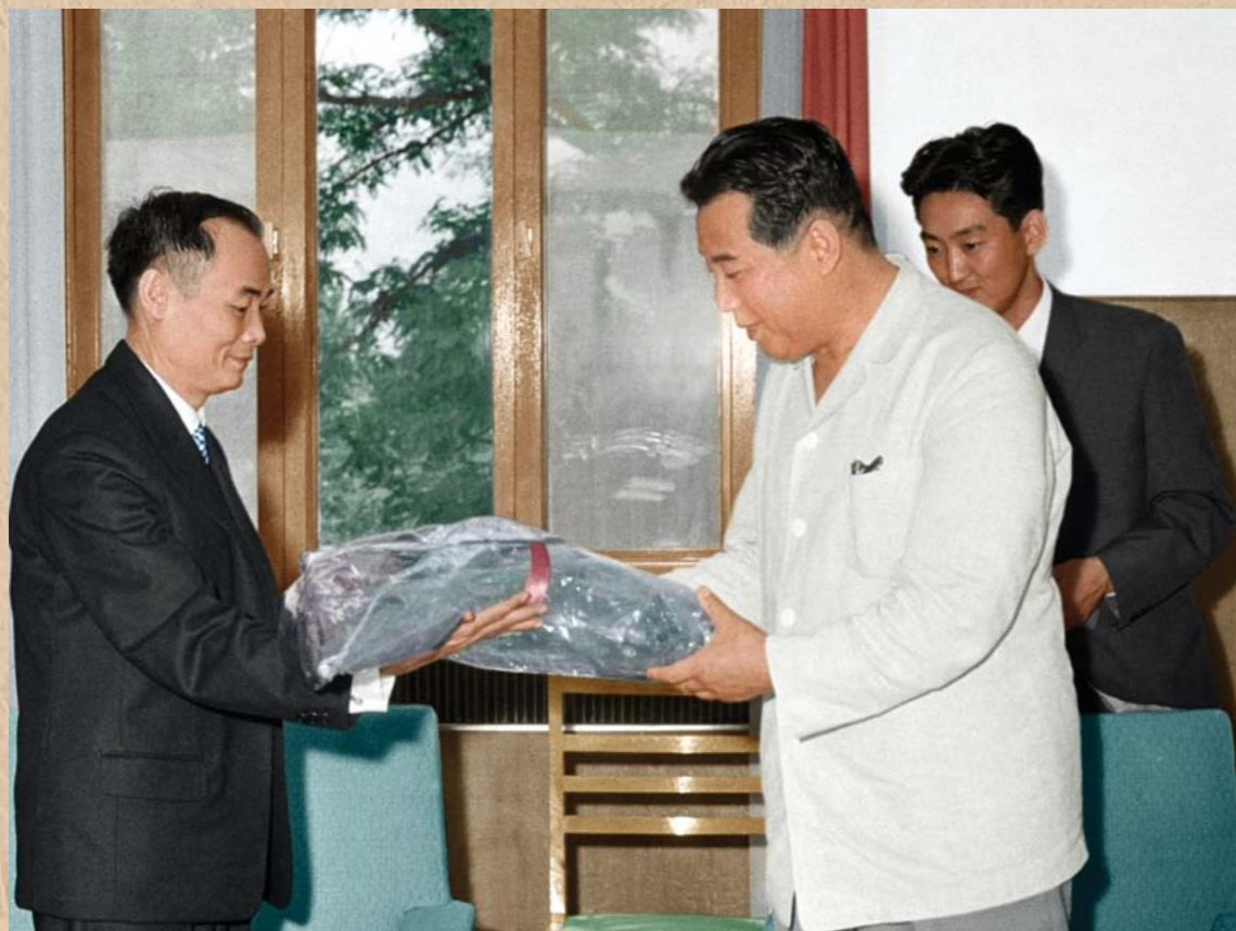
주조 남부월남민족해방전선 대표를 접견하시는 위대한 수령 김일성동지 주체55(1966)년 7월 Kim Il Sung meeting the representative of the National Front for the Liberation of the South in the DPRK in July 1966