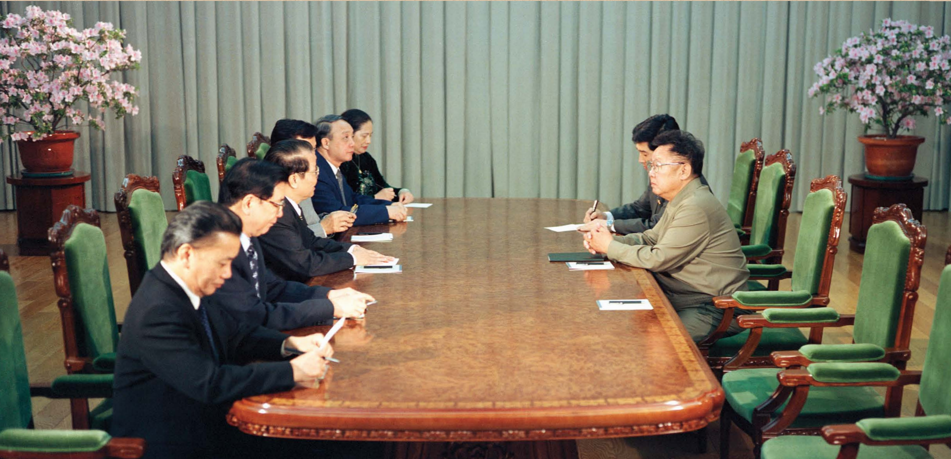
월남사회주의공화국 주석 쩐 득 르영동지와 회담하시는 위대한 령도자 김정일동지 주체91(2002)년 5월 Kim Jong Il having talks with Tran Duc Luong in May 2002