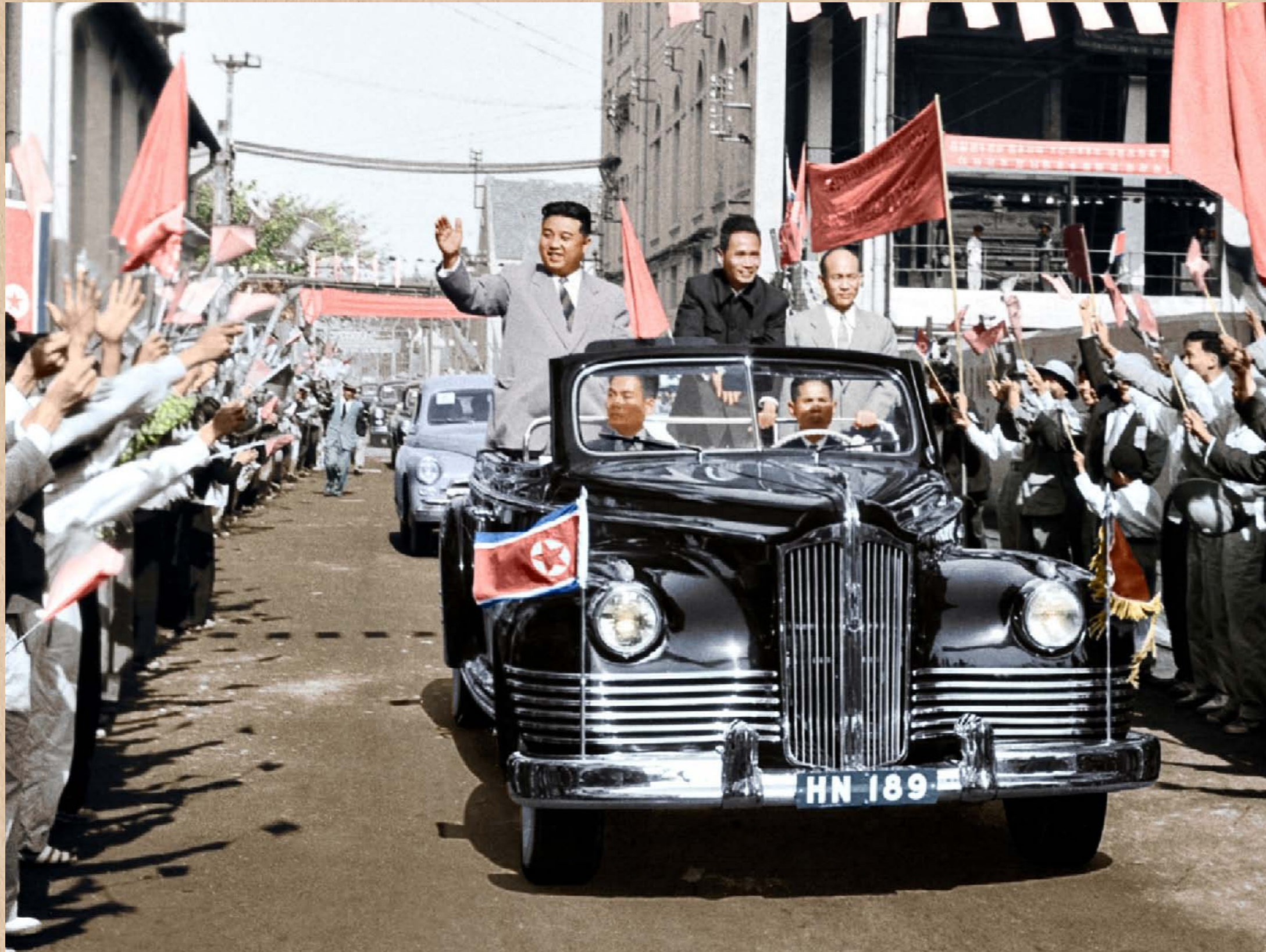
하노이시민들로부터 열렬한 환영을 받으시는 위대한 수령 김일성동지 주체47(1958)년 11월 Kim Il Sung being given an enthusiastic welcome from Hanoi citizens in November 1958