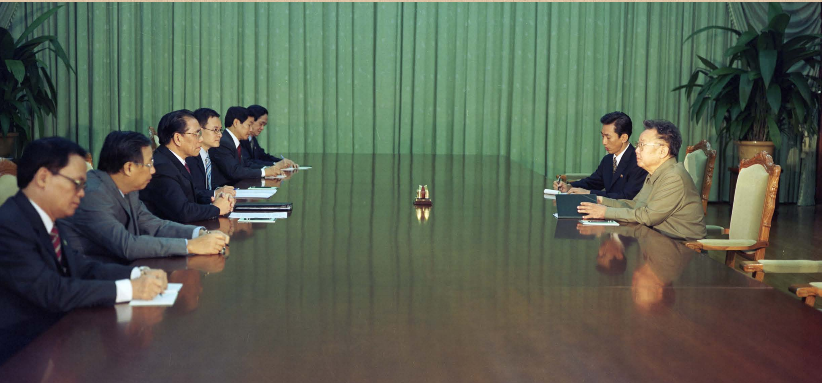
월남공산당 중앙위원회 총비서 농 득 마잉동지와 회담하시는 위대한 령도자 김정일동지 주체96(2007)년 10월 Kim Jong Il and Nong Duc Manh having talks in October 2007