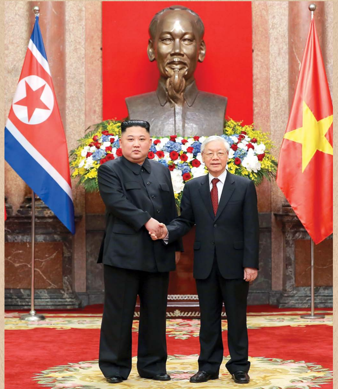
웬 푸 총동지와 기념사진을 찍으시는 경애하는 최고령도자 김정은동지 주체 108(2019)년 3월 Kim Jong Un and Nguyen Phu Trong posing for a photograph in March 2019