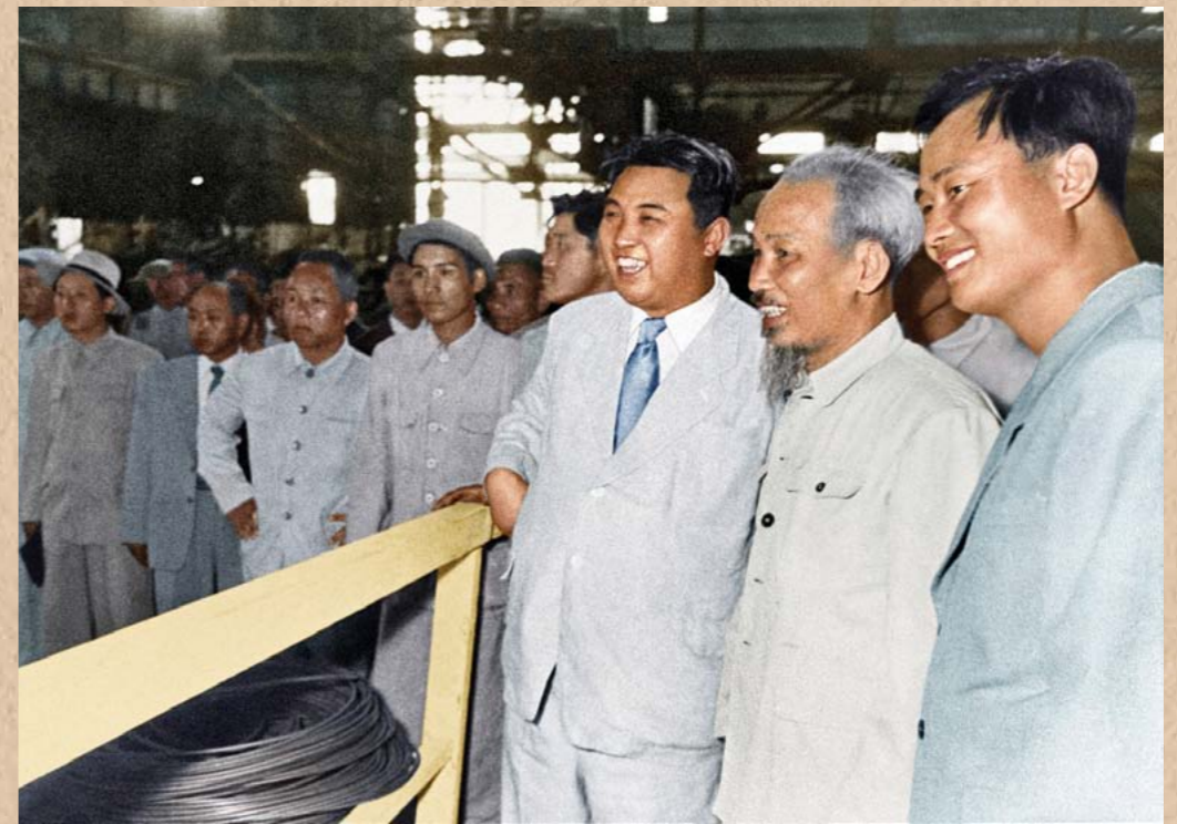
월남민주공화국 주석 호지명동지와 함께 강선제강소를 현지지도하시는 위대한 수령 김일성동지 주체46(1957)년 7월 Kim Il Sung and Ho Chi Minh visiting the Kangson Steel Plant in July 1957