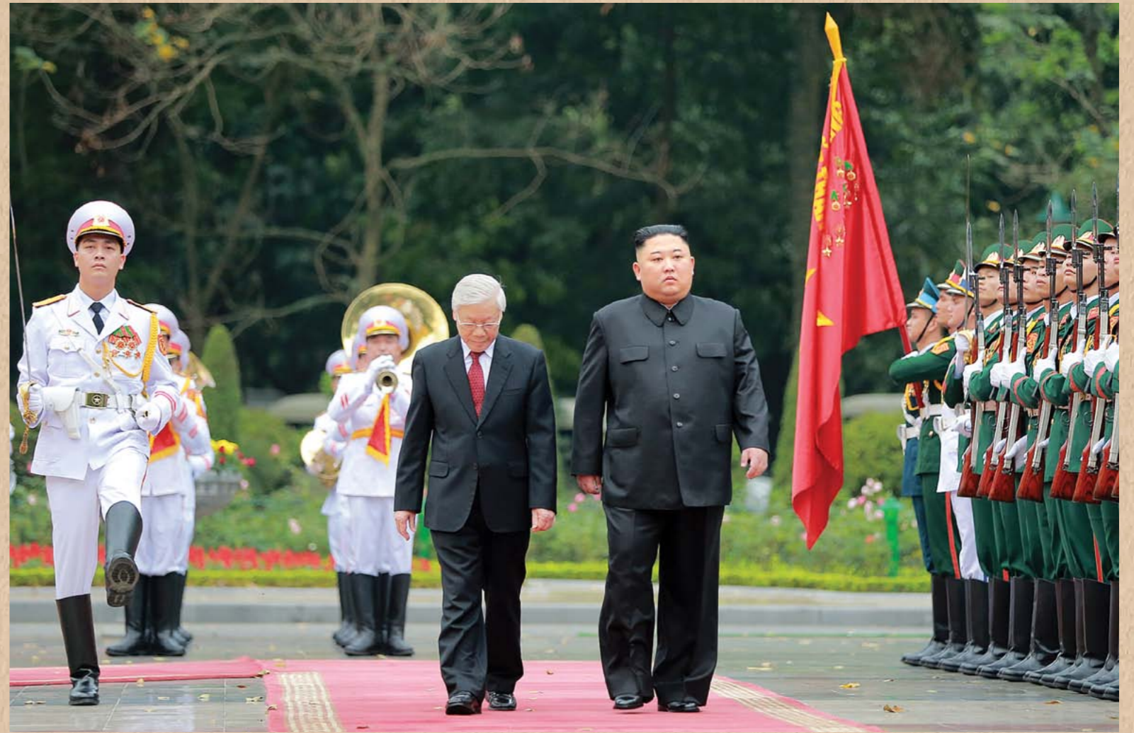
월남인민군 륝군, 해군, 공군병예위병대를 사열하시는 경애하는 최고령도자 김정은동지 주체 108(2019)년 3월 Kim Jong Un reviewing the guards of honour of the three services of the People's Army of Vietnam in March 2019