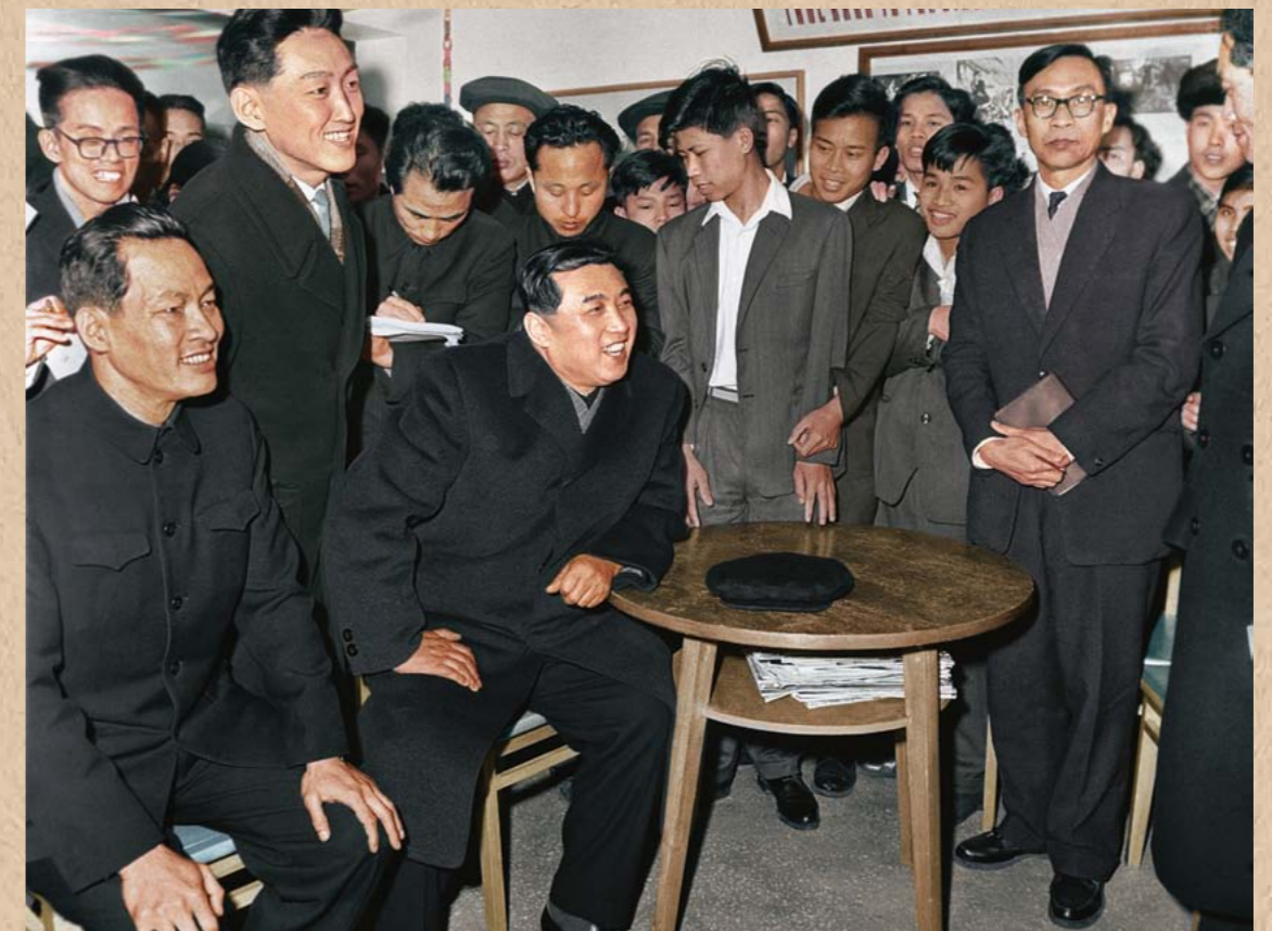
월남류학생들과 담화하시는 위대한 수령 김일성동지 주체56(1967)년 2월 Kim Il Sung having talks with Vietnamese students in the DPRK in February 1967