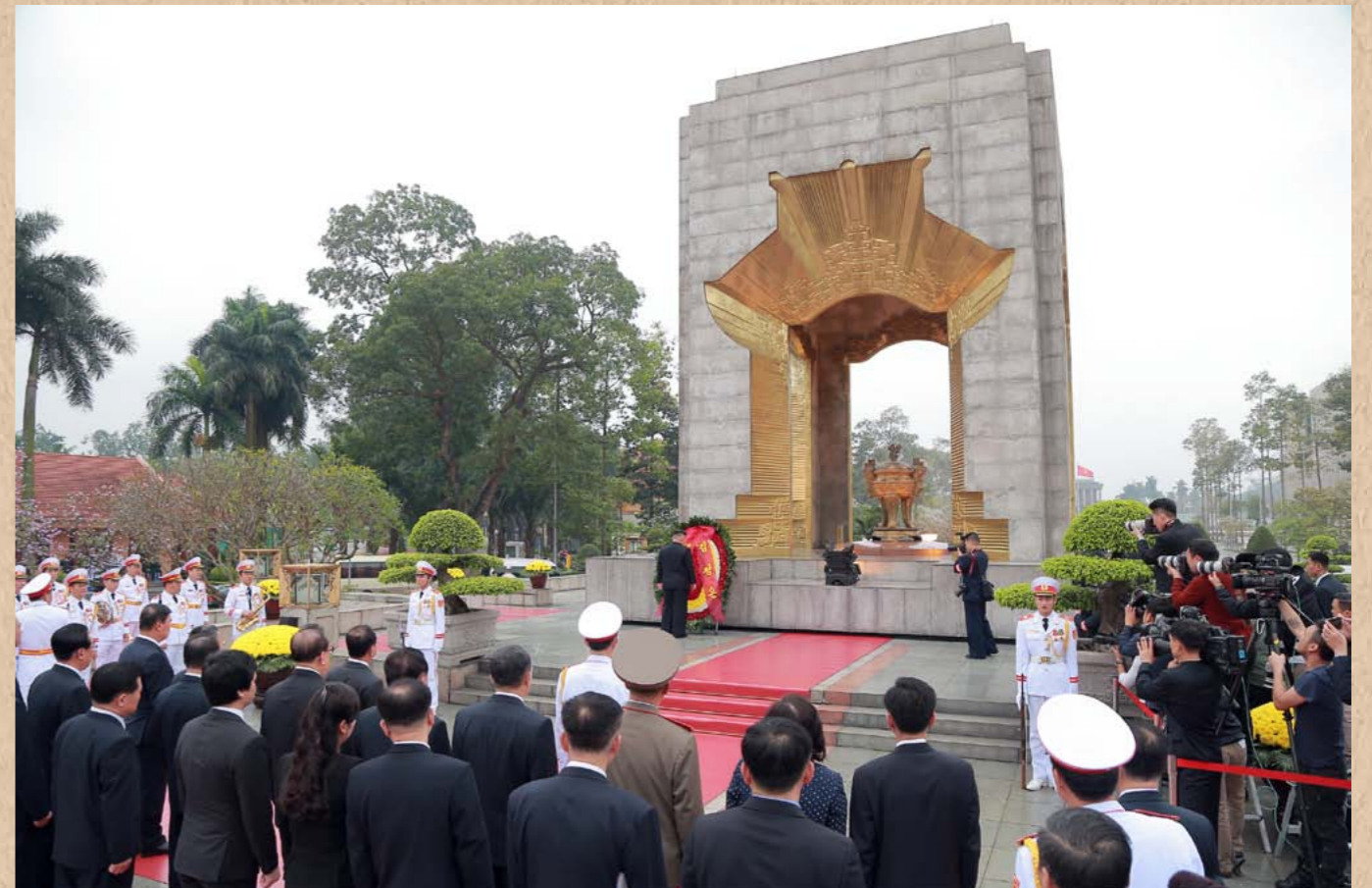
호지명주석의 묘에 화환을 진정하시는 경애하는 최고령도자 김정은동지 주체108(2019)년 3월 Kim Jong Un paying a floral tribute to the Mausoleum of President Ho Chi Minh in March 2019