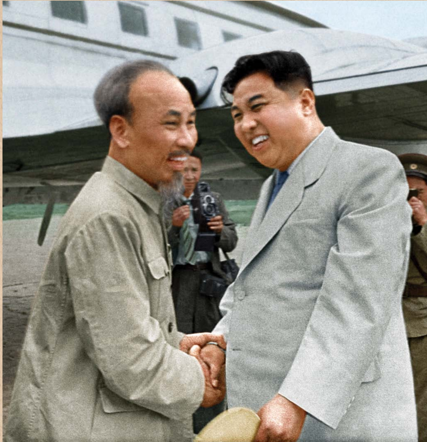
조선을 방문하는 월남민주공화국 주석 호지명동지를 맞이하시는 위대한 수령 김일성동지 주체46(1957)년 7월 President Kim Il Sung meeting Ho Chi Minh, president of the Democratic Republic of Vietnam, on his visit to the DPRK in July 1957