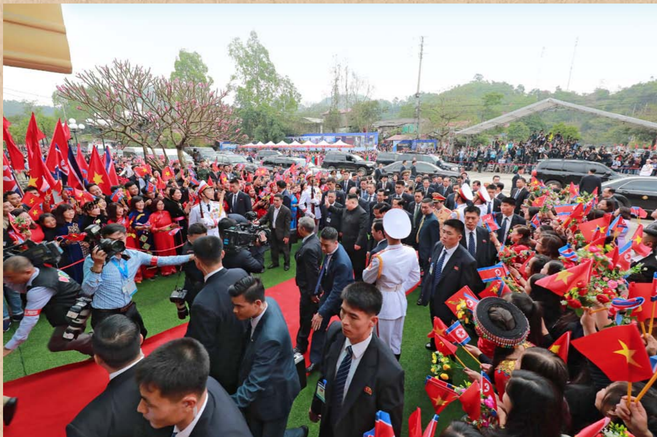
월남사회주의공화국에 대한 공식친선방문을 성과적으로 마치시고 출발하시는 경애하는 최고령도자 김정은동지 주체108(2019)년 3월 Kim Jong Un leaving Vietnam after rounding off his official goodwill visit in March 2019