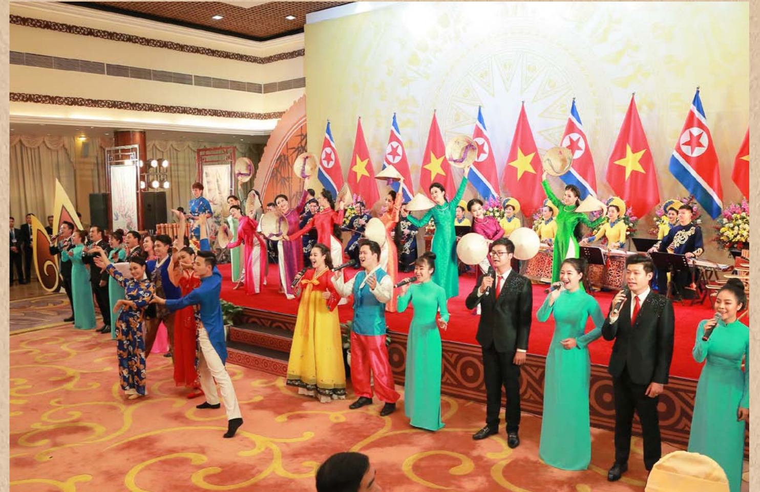
월남예술인들이 특별히 준비한 예술공연을 보시고 특색있고 성의있는 공연을 진행한 출연자들에게 감사를 표하시고 그들과 기념사진을 찍으시는 경애하는 최고령도자 김정은동지 주체108(2019)년 3월