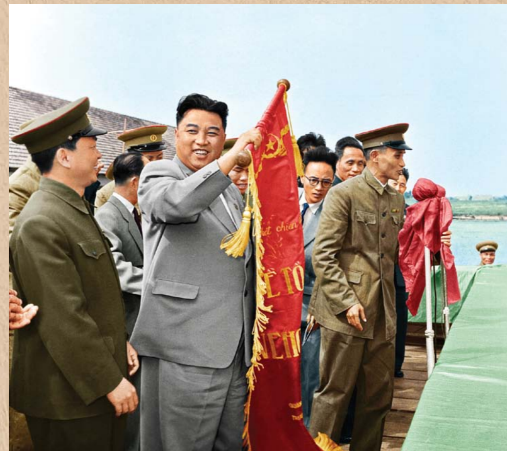
육군군관학교 학생들의 환영대회에 참석하신 위대한 수령 김일성동지 주체47(1958)년 12월