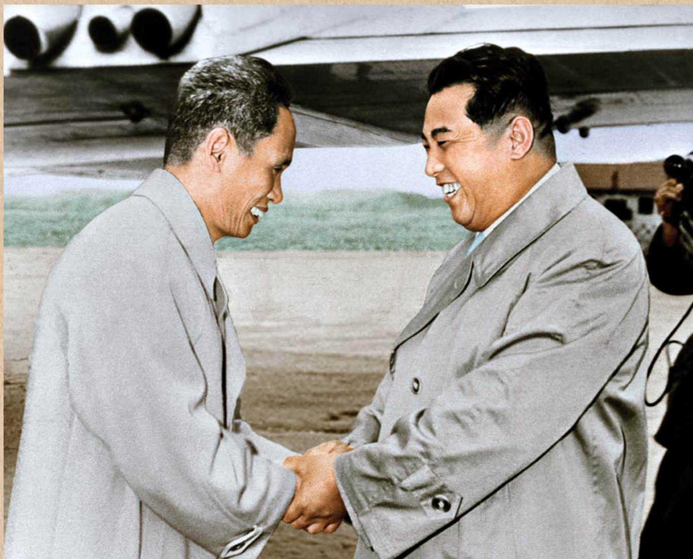
조선을 방문하는 월남민주공화국 정부수상 범문동동지를 맞이하신 위대한 수령 김일성동지 주체50(1961)년 6월