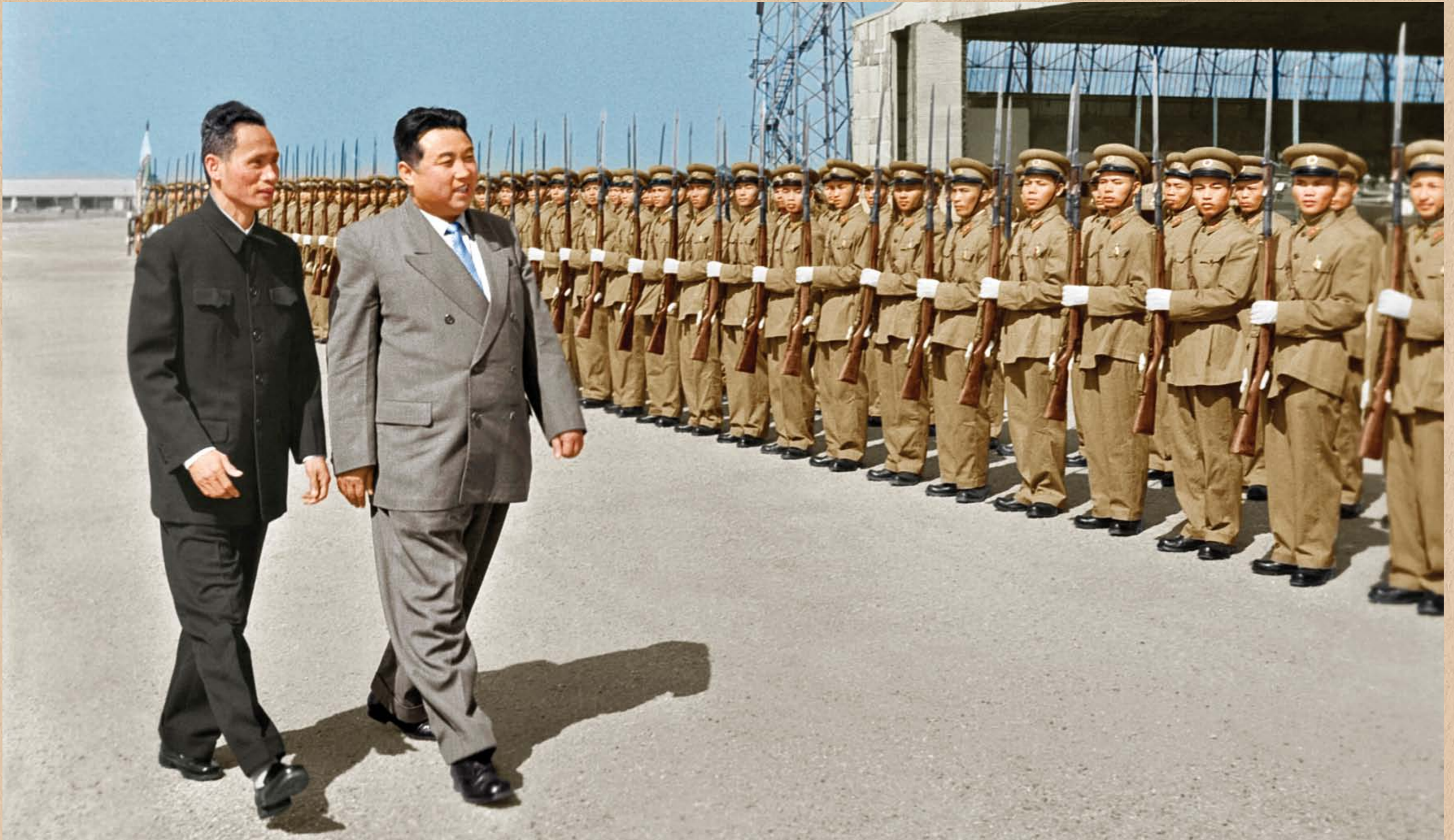
하노이비행장에서 명예위병대를 사열하시는 위대한 수령 김일성동지 주체47(1958)년 11월 Kim Il Sung reviewing the guard of honour at the Hanoi Airport, Vietnam, in November 1958