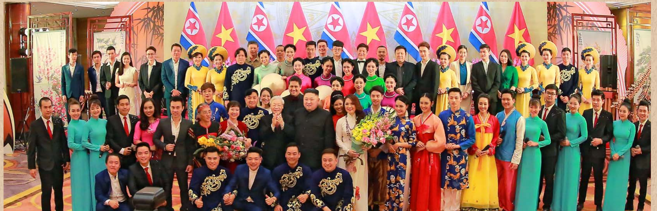
Kim Jong Un expressing thanks to the Vietnamese entertainers for their sincere and distinctive performance and having a photograph taken with them in March 2019