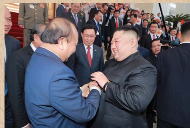
월남사회주의공화국 정부수상 웬 쉐언 폭동지와 상봉하시는 경애하는 최고령도자 김정은동지 주체108(2019)년 3월