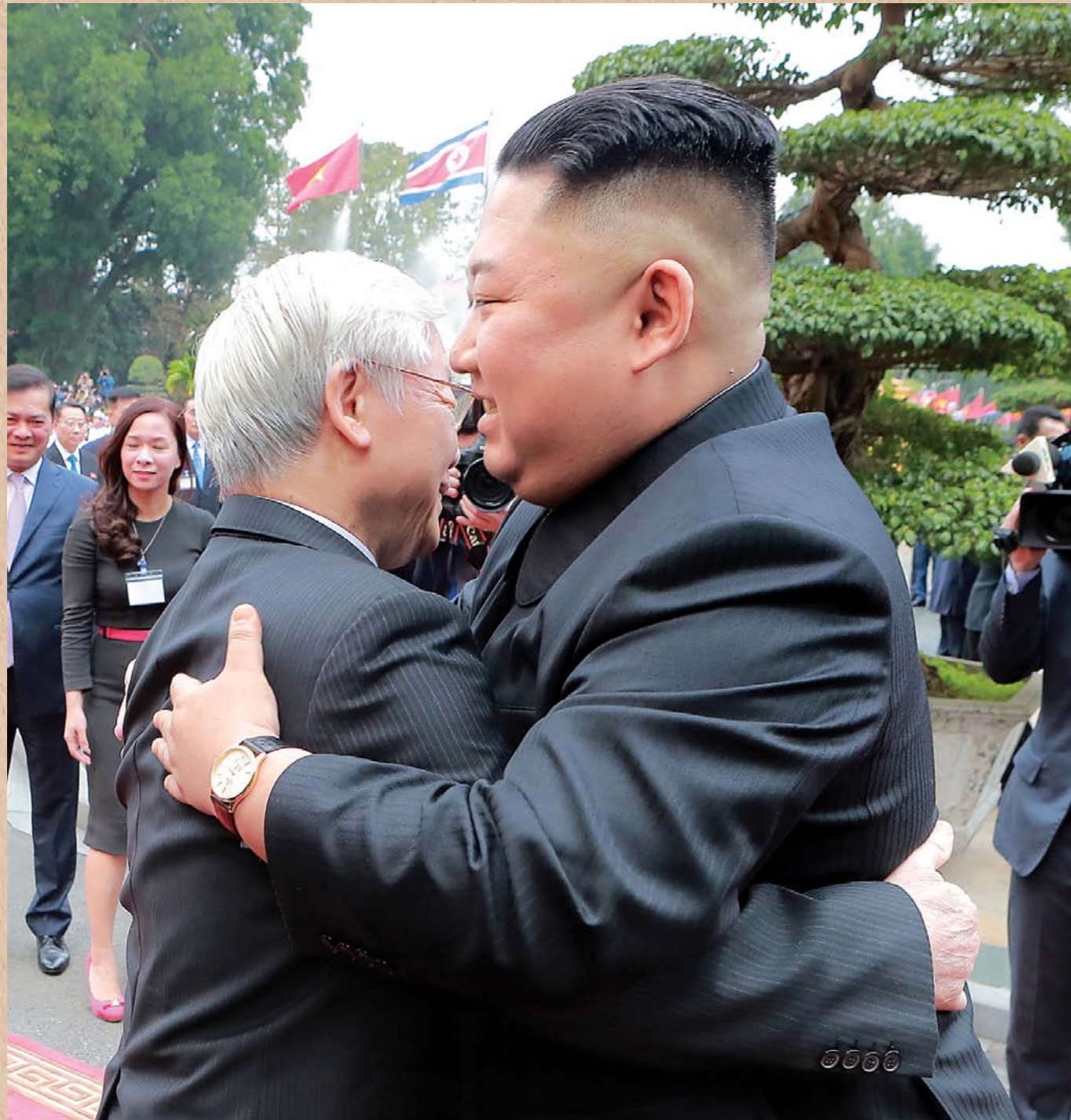
월남공산당 중앙위원회 총비서이며 월남사회주의공화국 주석이신 원 푸 쩡동지와 상봉하시는 조선로동당 위원장이시며 조선민주주의인민공화국 국무위원회 위원장이신 경애하는 최고령도자 김정은동지 주체 108(2019)년 3월