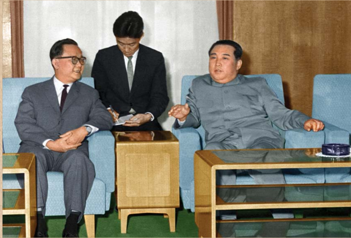
남부월남민족해방전선대표단 성원을 접견하시는 위대한 수령 김일성동지 주체54(1965)년 5월 Kim Il Sung meeting a member of the delegation of the National Front for the Liberation of the South in May 1965