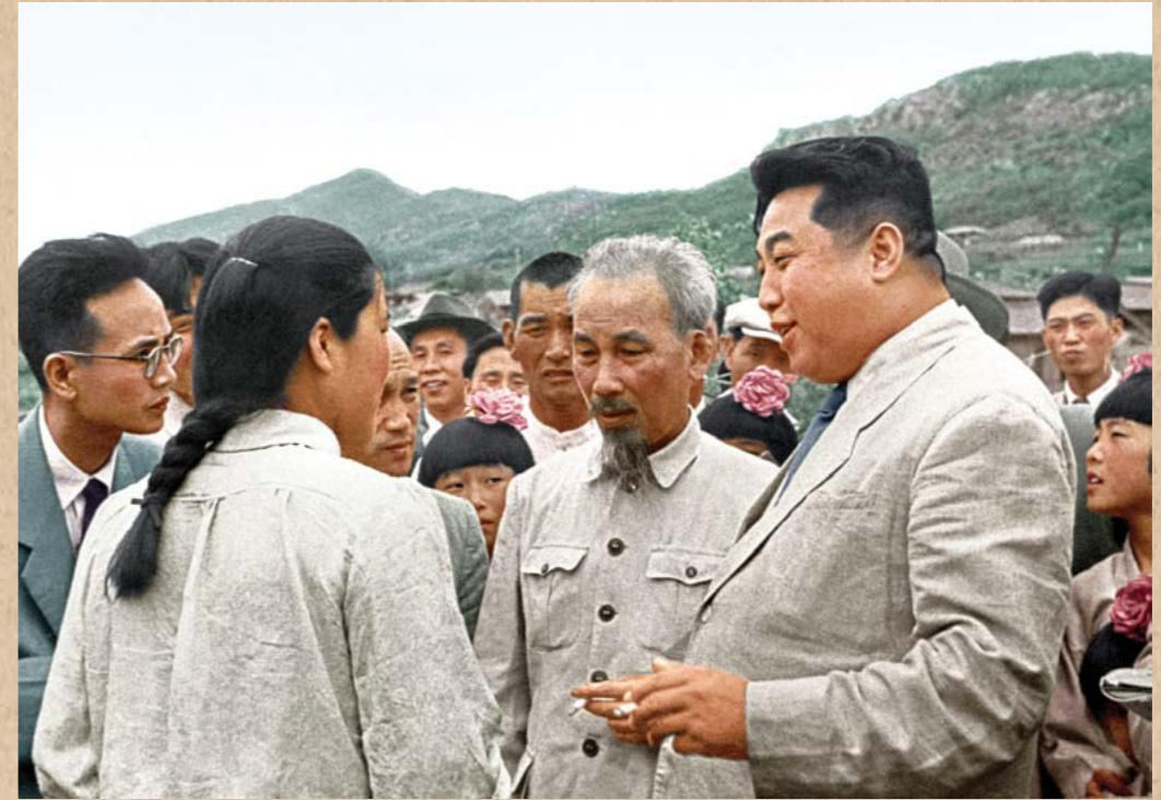
월남민주공화국 주석 호지명동지와 함께 강서군 고창농업협동조합을 현지지도하시는 위대한 수령 김일성동지 주체46(1957)년 7월 Kim Il Sung and Ho Chi Minh visiting Kochang Agricultural Cooperative in Kangso County in July 1957