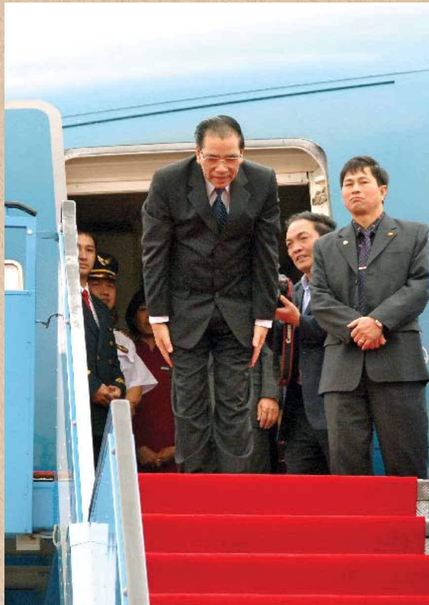
Kim Jong Il seeing off Nong Duc Manh in October 2007