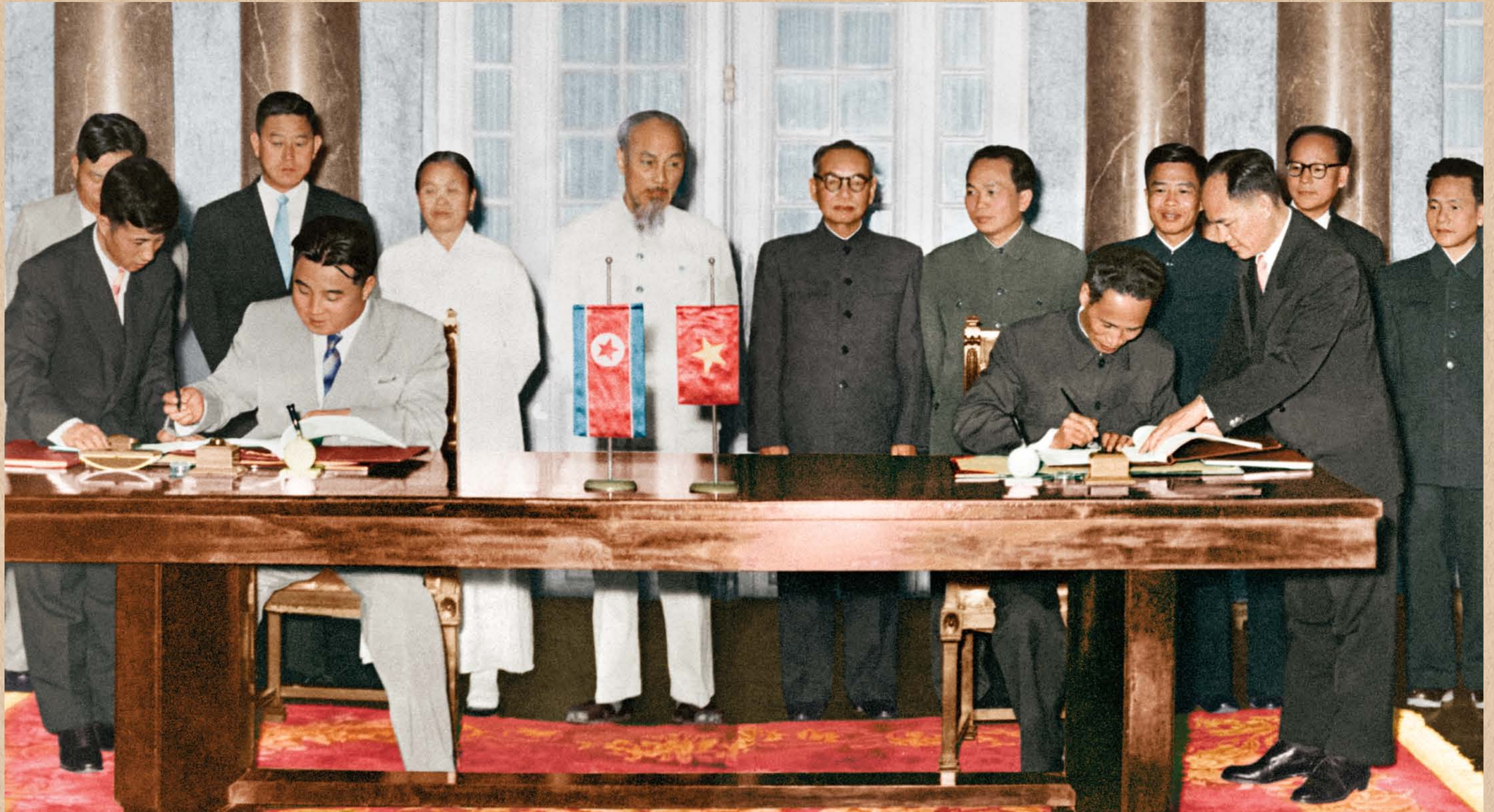
조선민주주의인민공화국 정부대표단과 월남민주공화국 정부대표단의 공동성명조인식에서 서명하시는 위대한 수령 김일성동지 주체47(1958)년 12월