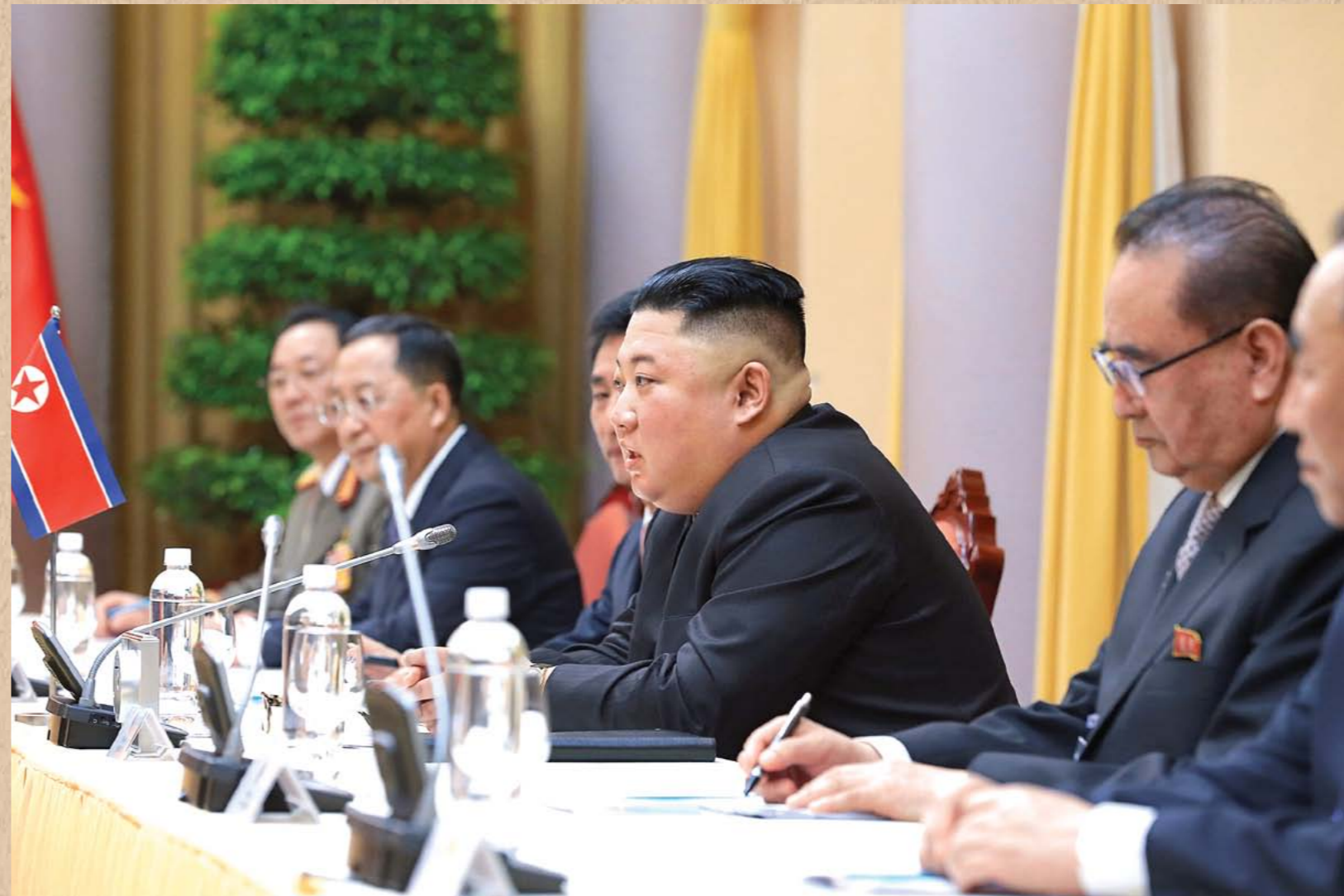
웬 푸 종동지와 회담하시는 경애하는 최고령도자 김정은동지 주체108(2019)년 3월 Kim Jong Un and Nguyen Phu Trong having talks in March 2019