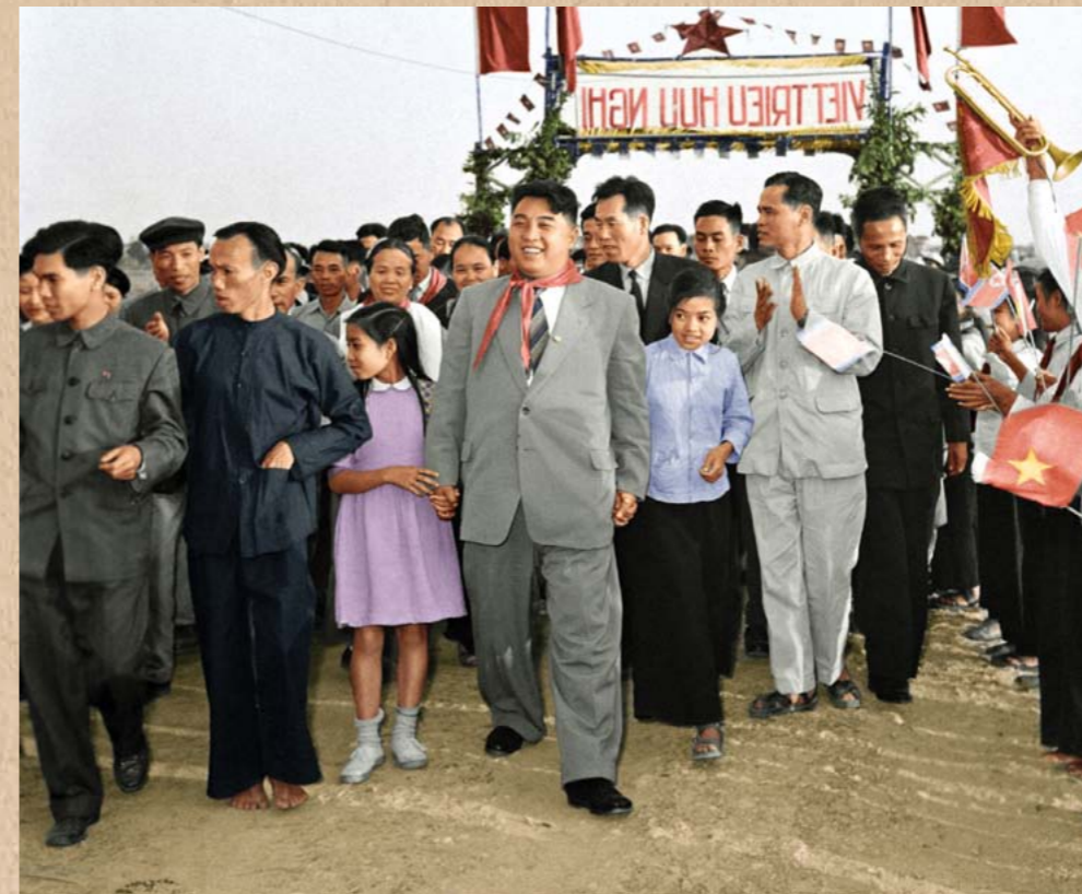
하노이시 교외 환라리에 있는 협동조합을 찾으신 위대한 수령 김일성동지 주체47(1958)년 11월