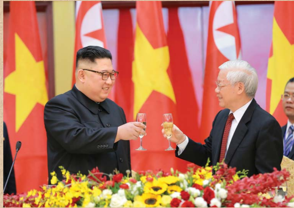
웬 후 쩡동지가 마련한 연회에 참석하신 경애하는 최고령도자 김정은동지 주체 108(2019)년 3월 Kim Jong Un at the banquet hosted by Nguyen Phu Trong in March 2019