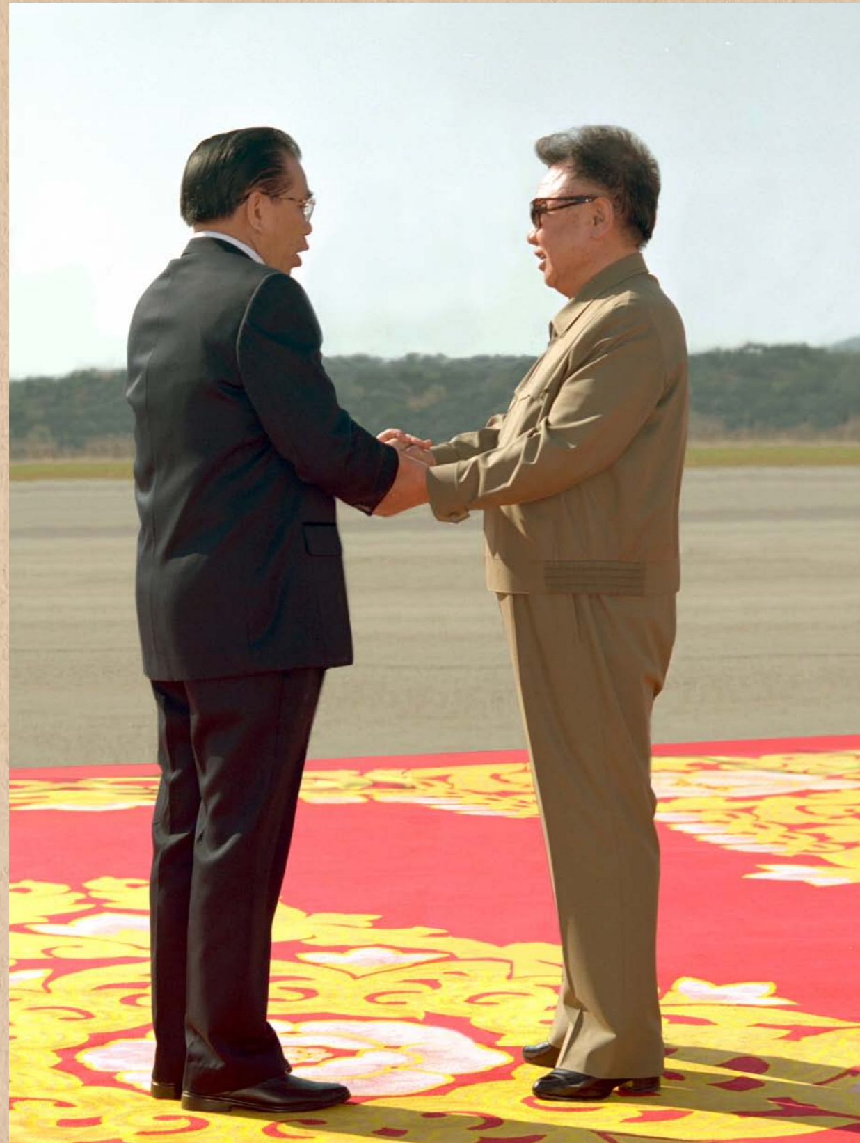
조선을 방문하는 월남공산당 중앙위원회 총비서 농 득 마잉동지를 맞이하시는 위대한 령도자 김정일동지 주체96(2007)년 10월