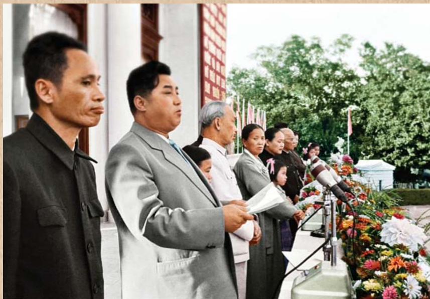
하노이시환영군중대회에서 연설하시는 위대한 수령 김일성동지 주체47(1958)년 11월 Kim Il Sung delivering a speech at the mass rally held to welcome him in Hanoi in November 1958