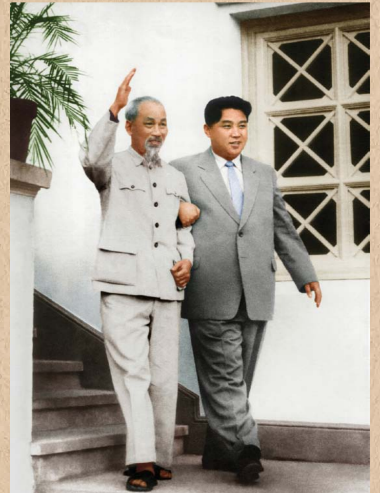
월남민주공화국 주석 호지명동지의 영접을 받으시는 위대한 수령 김일성동지 주체47(1958)년 11월 Kim Il Sung being greeted by Ho Chi Minh in November 1958