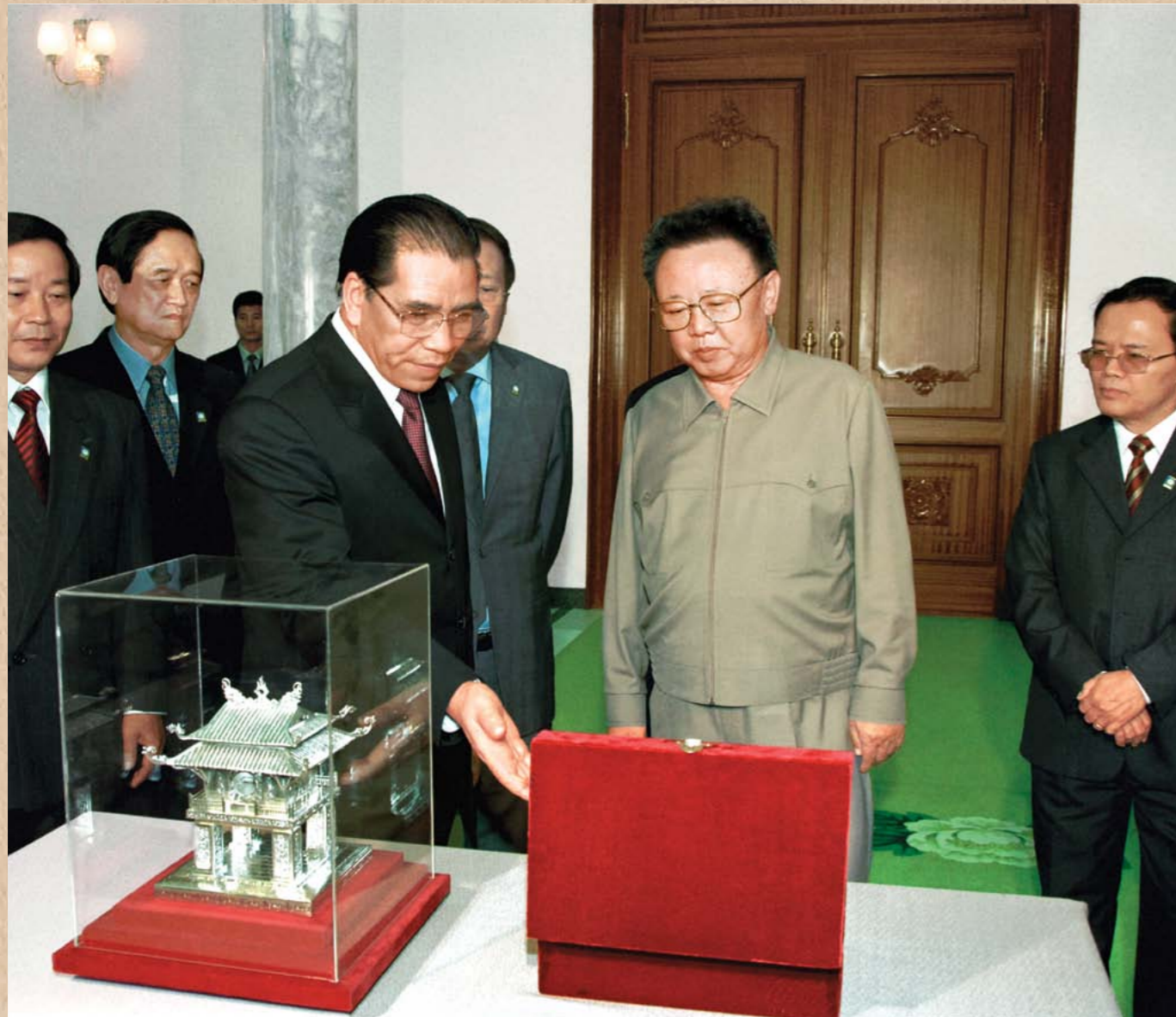
월남공산당 중앙위원회 총비서 농 득 마잉동지로부터 선물을 받으시는 위대한 령도자 김정일동지 주체96(2007)년 10월