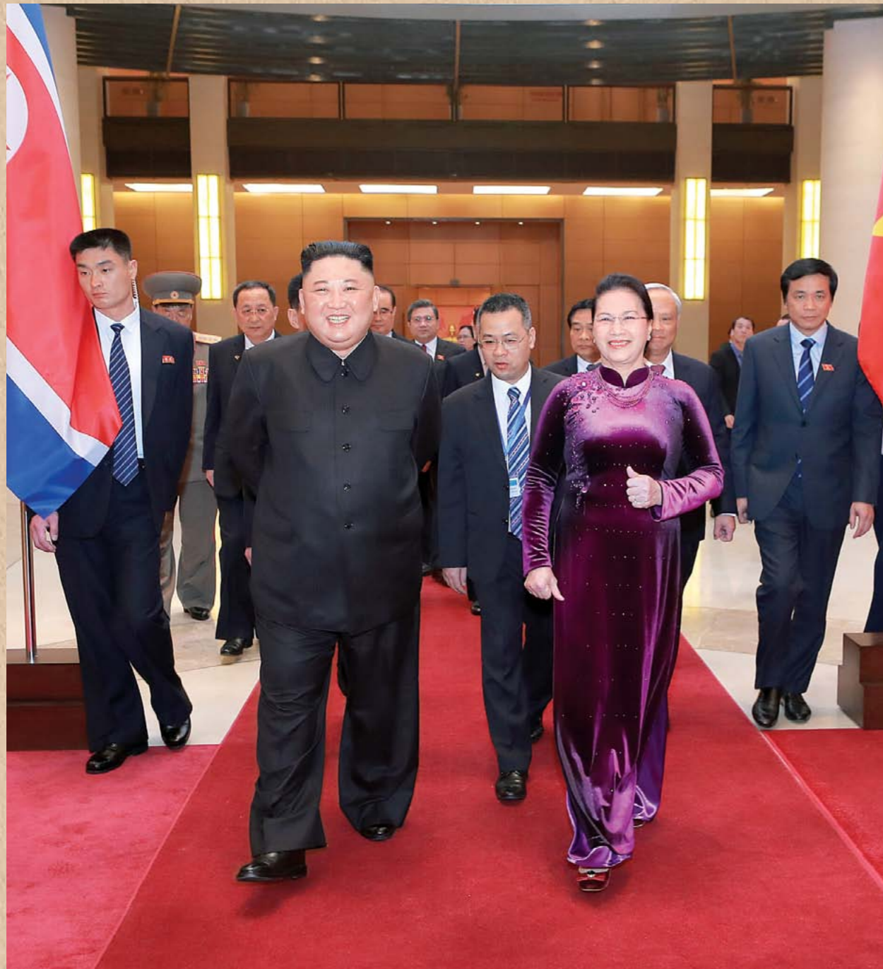
월남사회주의공화국 인민회의 의장 원 리 킴 응연동지와 상봉하시는 경애하는 최고령도자 김정은동지 주체108(2019)년 3월

Kim Jong Un meeting Nguyen Thi Kim Ngan, chairwoman of the Vietnamese National Assembly in March 2019